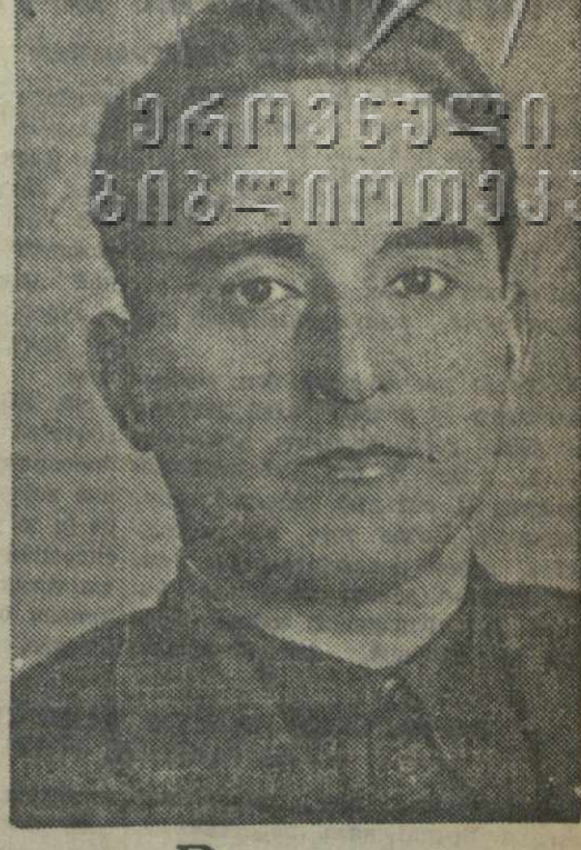
Виктор Иосифович Кукба

Тов. Хоштария — член ЦК ВКП(б) Грузии и ЦК ВКП(б) Грузии.