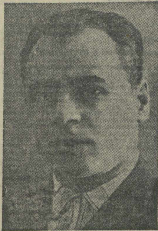
Всеволод Николаевич Меркулов