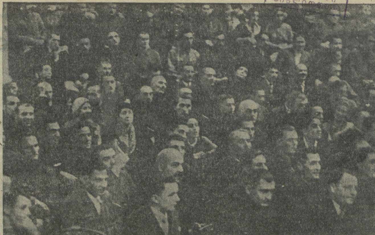
Выступление тов. Л. П. Берия, зарегистрированного кандидатом в депутаты Совета Союза по Тбилисскому—Сталинскому избирательному округу, на окружном предвыборном совещании.

В Тбилиси с огромным подъемом проходят участковые, районные, окружные предвыборные собрания и совещания. Горячим чувством патриотизма, преданностью большевистской партии, великому вождю, родному СТАЛИНУ проникнуты выступления избирателей, призванных голосовать за лучших сынов нашей великой родины.