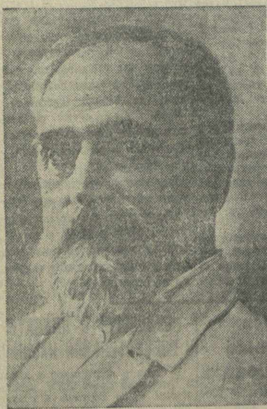
Филипп Евсеевич Махарадзе

Избиратели Сухумского сельского избирательного округа единодушно отдадут свои голоса за старейшего большевика, преданного до конца делу Ленина — Сталина, — Михаила Григорьевича Цхакая.