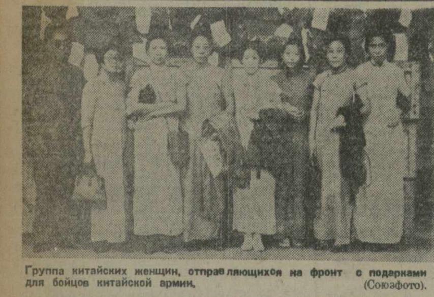
Группа китайских солдат, отправляющихся на фронт с подарками для бойцов китайской армии.

ТОКИО, 26. (ТАСС). По сообщениям агентства «Домей пуна», сегодня утром японские войска захватили Чанси — стратегический пункт на дороге к Нанкину. Японские войска ведут наступление в западном направлении вдоль Шанхай — Нанкинской железной дороги, а также вдоль берегов озера Тайху и сейчас оказывают давление на позиции китайских войска западнее озера Тайху. На этом участке в ближайшие дни ожидается решительное сражение между японскими и китайскими войсками.