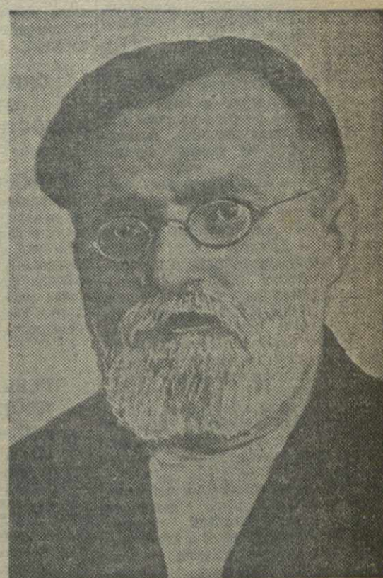
Михаил Григорьевич Цхакая

Агитационно-пропагандистская и организационная работа необходима, чтобы помочь каждому неграмотному избирателю и каждому избирателю с каким-нибудь физическим недостатком явиться на выборы хозяином своей воли, а не попасть в лапы недобросовестного «советчика».