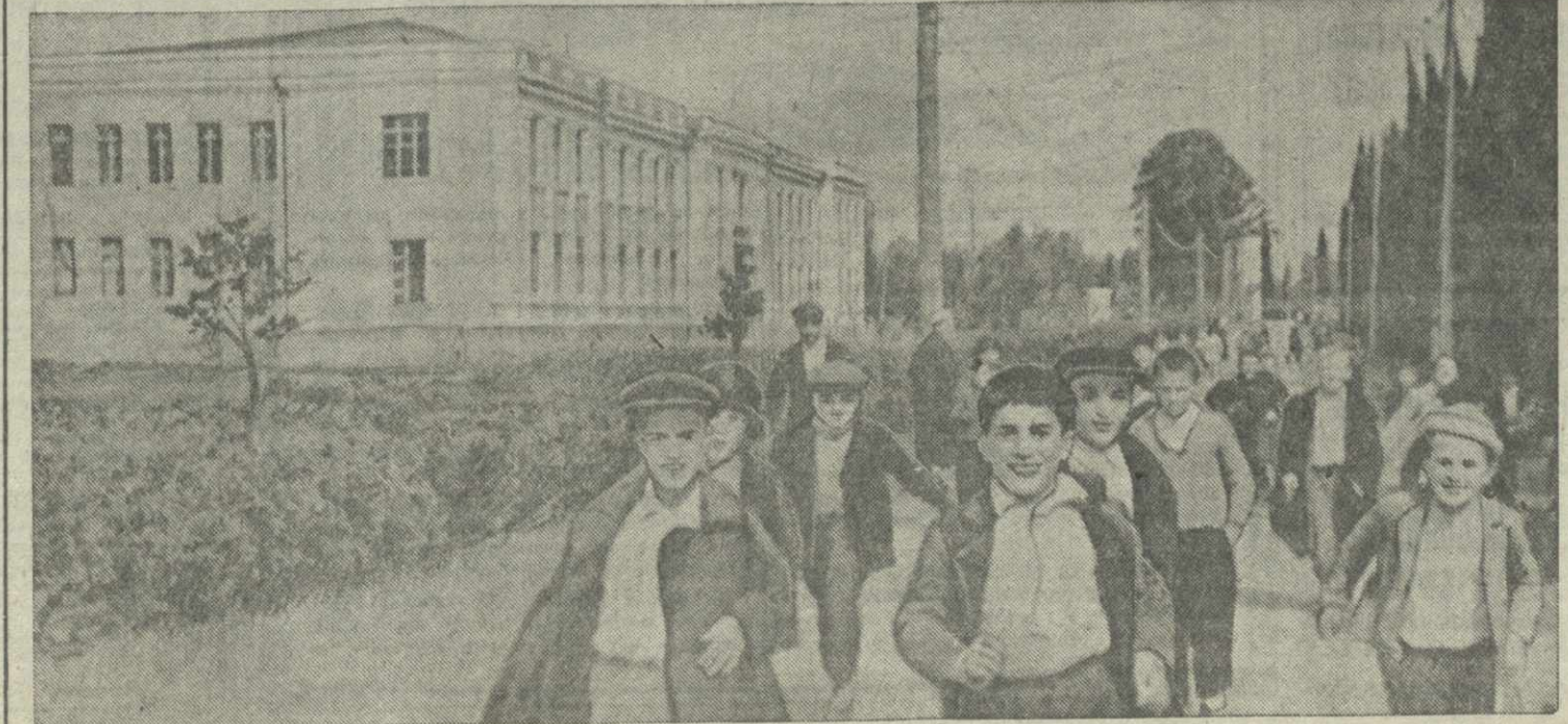
У нового здания 1-й Зугдидской полной средней школы.