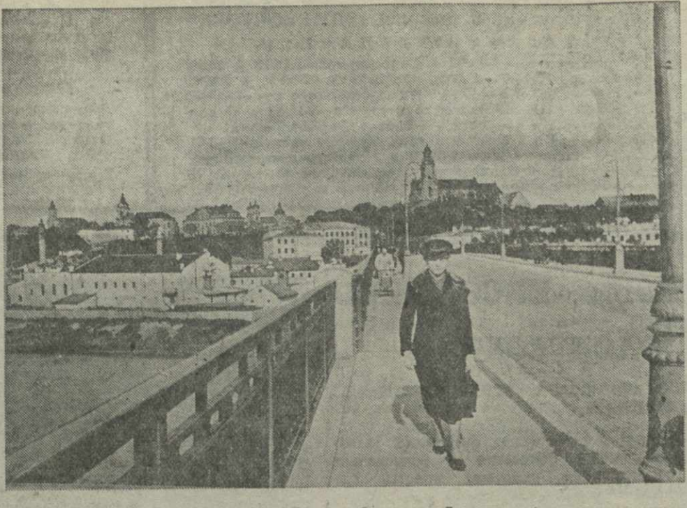
Мост через реку Неман в городе Гродно (Западная Белоруссия).

В Государственной публичной исторической библиотеке в Москве открылась выставка материалов по истории Западной Украины и Западной Белоруссии.