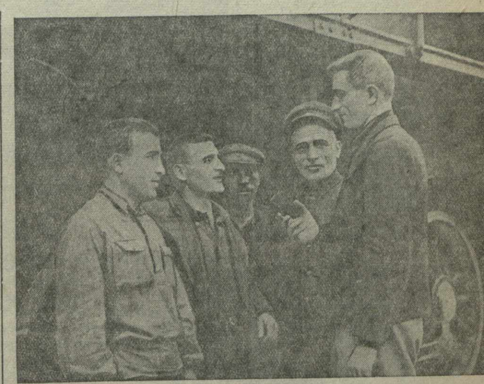
Включившись в предоктябрьское соревнование, паровозные бригады депо Тбилиси взяли обязательство водить тягловесные поезда и экономить топливо.

В заключение мне хотелось бы подчеркнуть, что пакт укрепляет мир и безопасность.