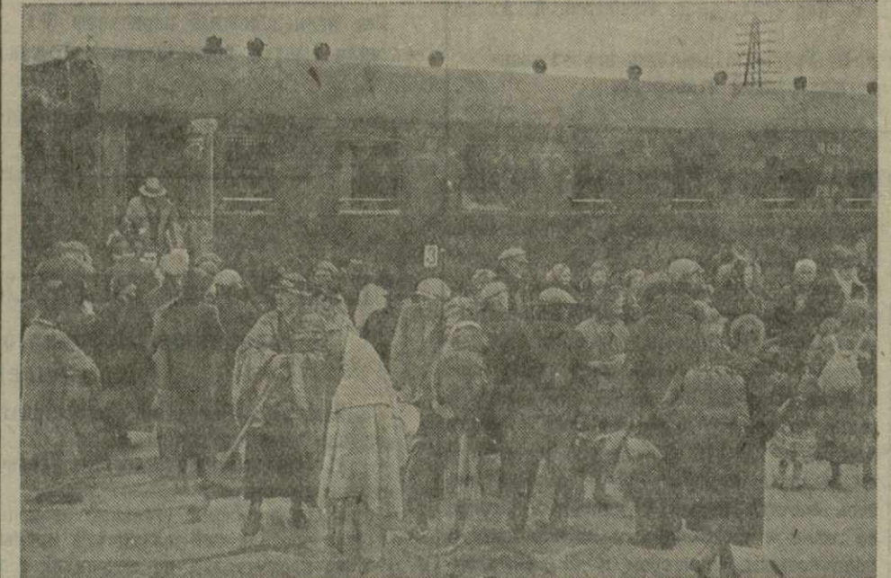
Восстановлено пассажирское движение на линии Белосток — Гродно, Белосток — Вильно. На снимке: беженцы со станции Белосток направляются в свои родные места.

По всей Западной Белоруссии с большим подъемом проходят митинги и собрания трудящихся. Трудящиеся Западной Белоруссии приветствуют предстоящий созыв Народного собрания.