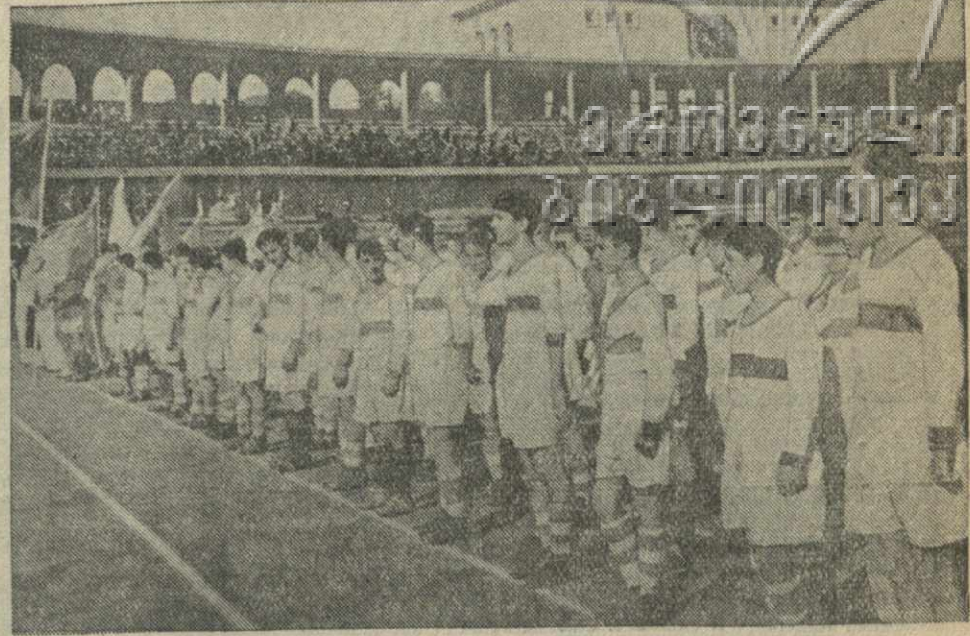
На параде футбольных команд Тбилиси перед осенним розыгрышем городского первенства.

ЛОНДОН, 12. (ТАСС). 10 октября в Лондоне состоялось частное совещание 18 лейбористских депутатов парламента, время которого обсуждался вопрос о том, какие должны быть приняты меры, чтобы обеспечить немедленное открытие переговоров о заключении мира.