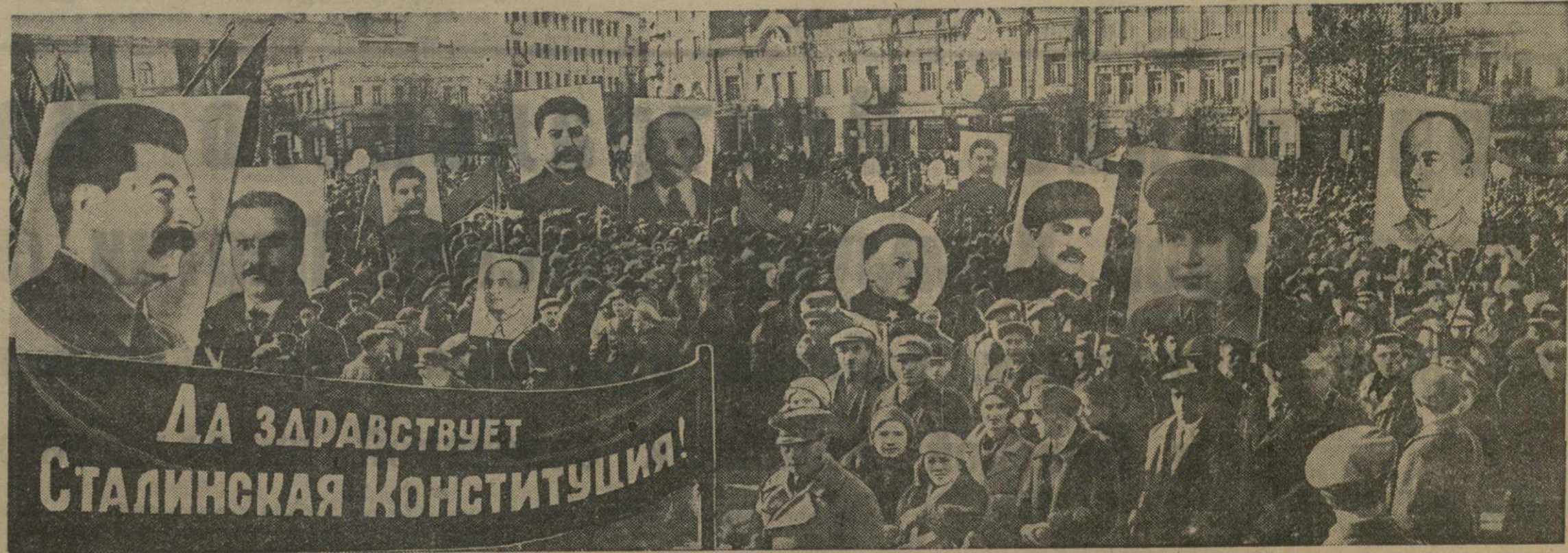
Да здравствует Сталинская Конституция!

Праздник закончился выступлением корпоративных ансамблей и физкультурников.