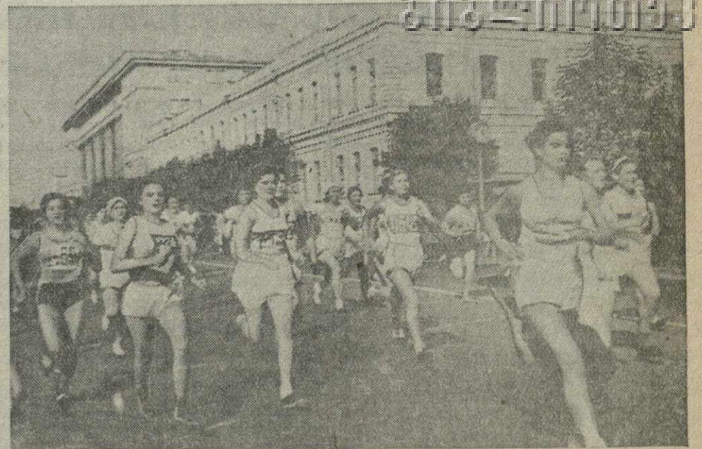
Массовый традиционный кросс имени Ворошилова в Тбилиси. На снимке: девушки-участницы забега на 500 метров.

К Октябрьским праздникам Тбилисская табачная фабрика выпускает новые папиросы «Октябрьские» в красивую оформленную упаковку, а также новый высший сорт папирос «Сказки», в той же упаковке, что и папиросы этой марки производятся Московской и Ленинградской табачных фабрик.