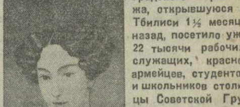
Выставка пользуется большим успехом. Об этом ярче всего свидетельствуют восторженные отзывы о ней, которыми заполнено 5 книг впечатлений. Посетители выставки выражают пожелание, чтобы Ленинградский Эрмитаж чаще знакомил трудящихся Тбилиси со своими неисчерпаемыми художественными сокровищами.

На снимках: сверху — репродукция картины неизвестного художника XVII в. школы Рембрандта — «Пир Эсфири», внизу — репродукция с картины художника Христины Робертсон (XIX в.) — «Женский портрет».