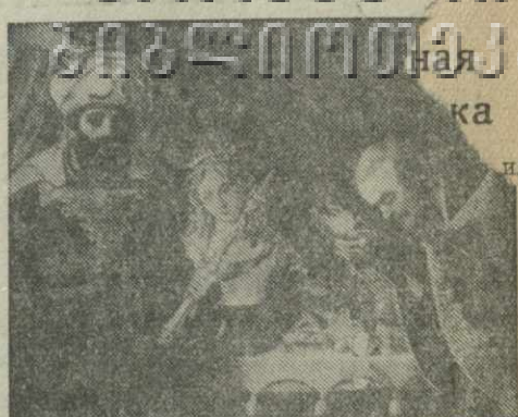
Выставку Ленинградского Эрмитажа, открывшуюся в Тбилиси 1/2 месяца назад, посетило уже 22 тысячи рабочих, служащих, студентов и школьников столицы Советской Грузии.