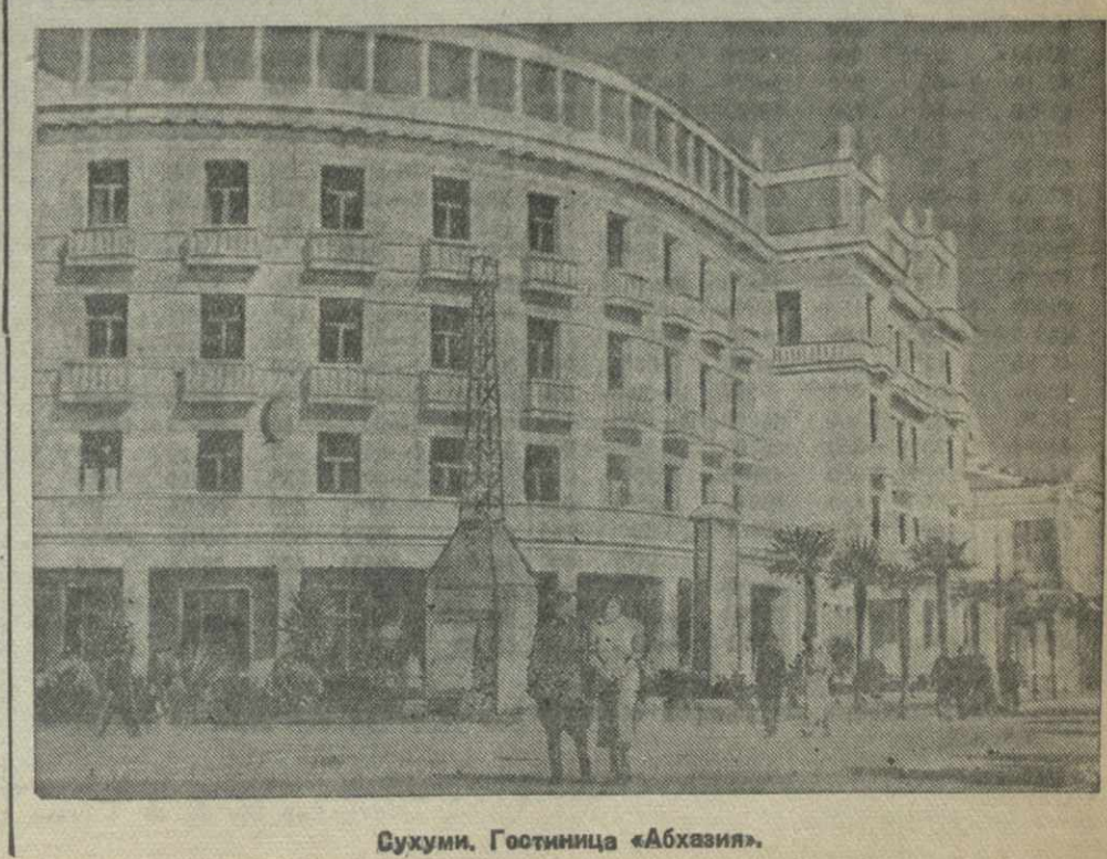
Сухуми. Гостиница «Абхазия».

Работа бригад показала необходимость упорядочить в городе нумерацию домов и содержание домовых книг. В городе еще есть дома, не имеющие номеров. В некоторых домах вовсе нет домовых книг.