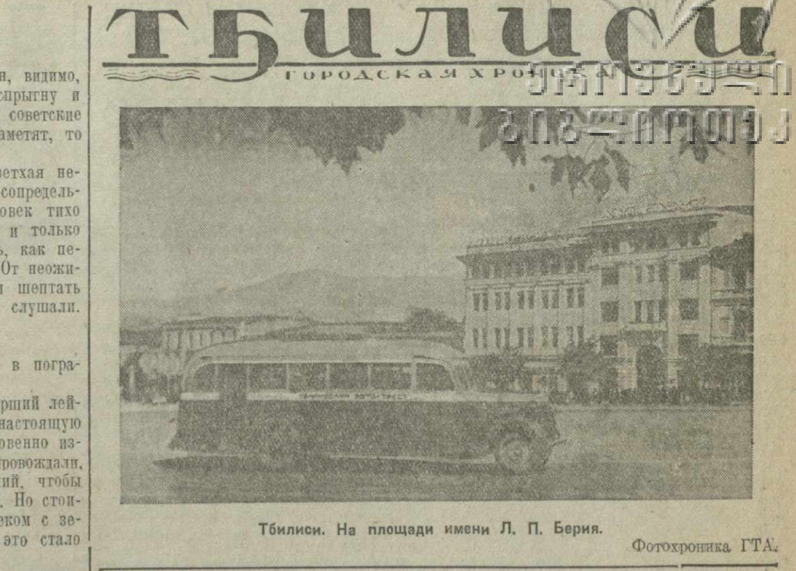
Тбилиси. На площади имени Л. П. Берия.

«Мы, дети трудящихся одной из передовых республик Советского Союза, — пишут они в своем письме. — Мы счастливые дети. У нас есть все возможности, чтобы отчаянно учиться. Мы стоим в пионерской организации, с гордостью носим красный галстук. В отряде мы читали о положении народов Западной Украины и Западной Белоруссии, об освобождении их от панского насилие. Мы с радостью узнали о том, что вы, наши дорогие братья, уже начали учиться на родном языке. У каждого из нас возникла мысль написать вам письмо. Нам с вами разделяют огромные