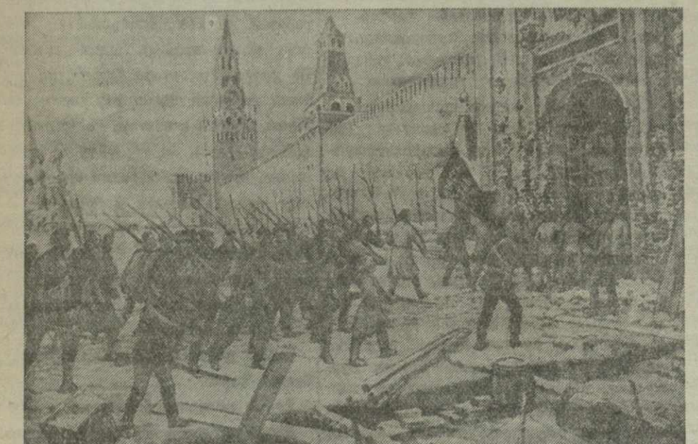
Вступление Красной гвардии в Кремль. С картины художника Лиснер. (Музей Центрального Дома Красной Армии им. М. В. Фрунзе).

На торжественном открытии дороги, праздник юных железнодорожников, приедут 200 гостей — пионеры, отличники учебы Москвы, Ленинграда, Куйбышева, Днепрпетровска и других городов.