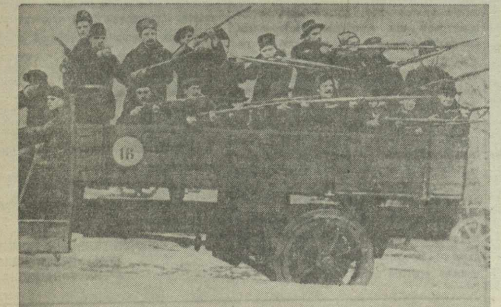
Красногвардейцы-путловцы в Октябрьские дни 1917 года. (По материалам Музея революции в Ленинграде).