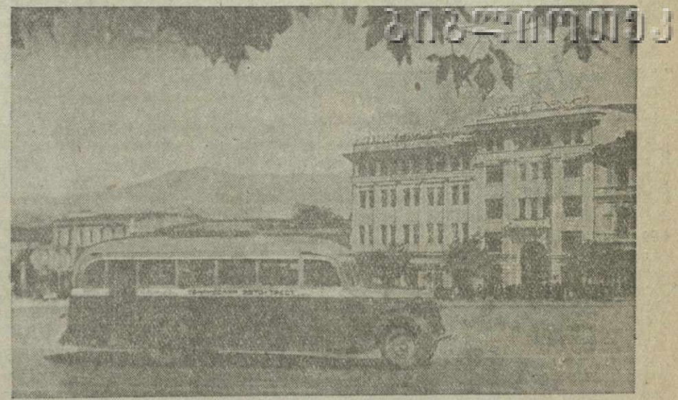
Тбилиси. На площади имени Л. П. Берия.