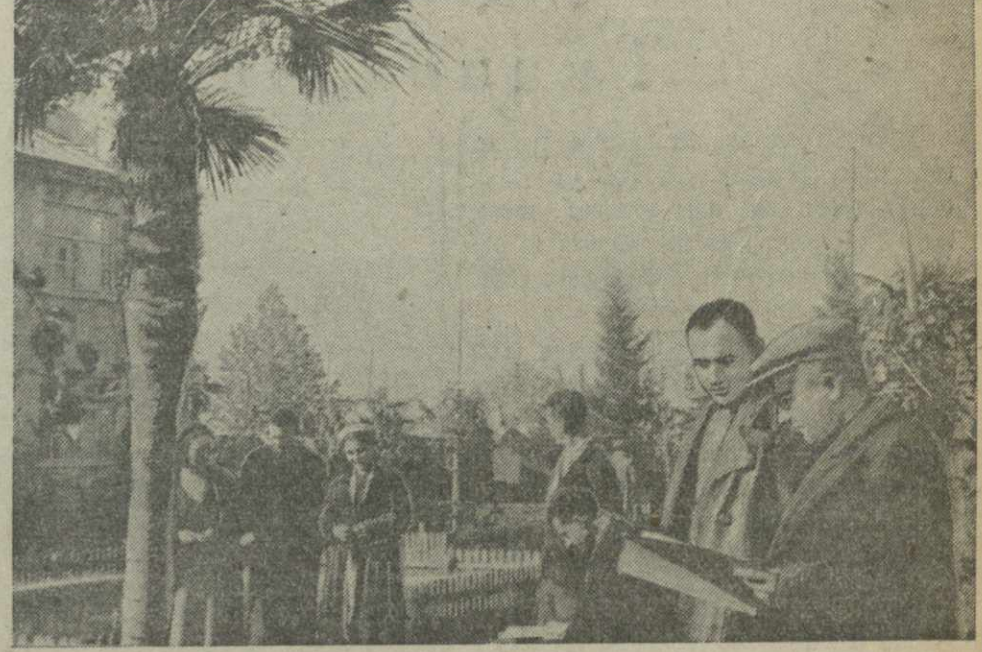
Уголок двора Тбилисского авторемонтного завода.