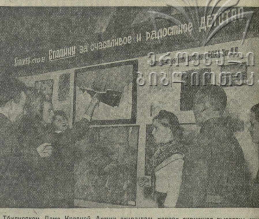
В Тбилисском Доме Красной Армии открылась первая окружная выставка художников творчества детей командиров.

Оперный театр города Кельна (Германия) возобновляет постановку оперы выдающегося русского композитора Мусоргского «Борис Годунов».