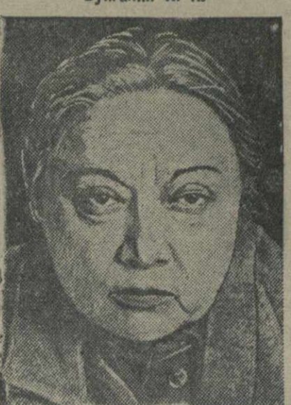
Крупская Н. К.