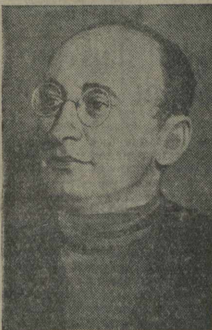
Берия Л. П.