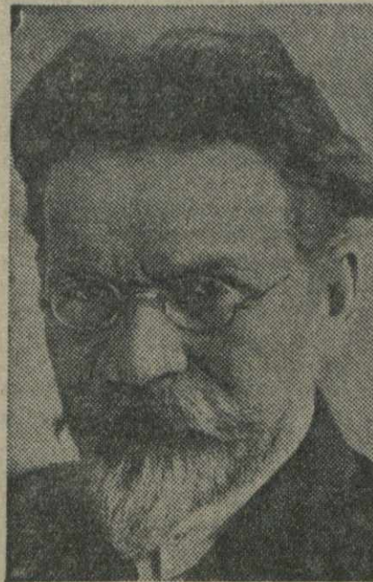
Калинин М. И.