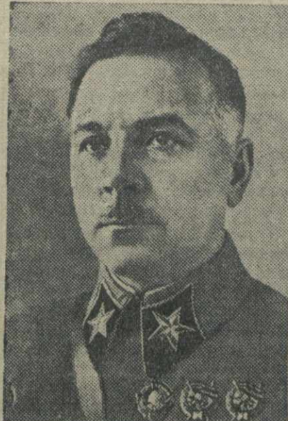
Ворошилов К. Е.