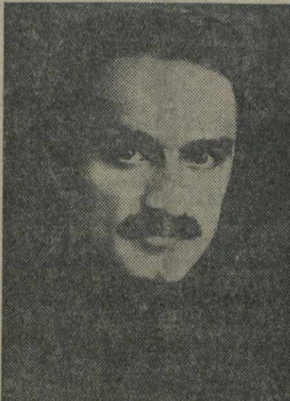
Микоян А. И.