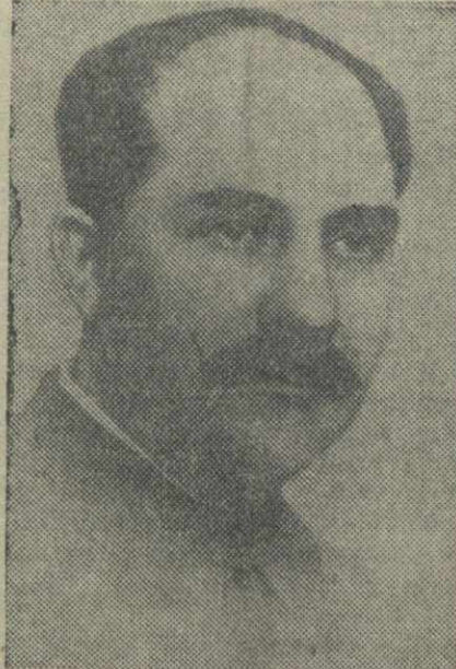
Каганович Л. М.