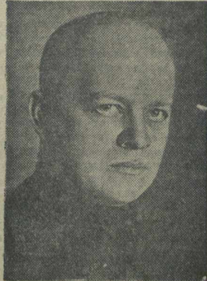
Косиор С. В.