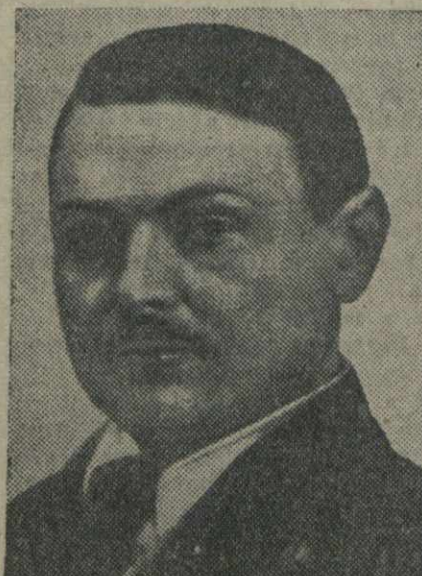
Жданов А. А.