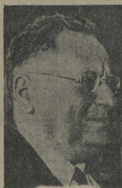
Литвинов М. М.