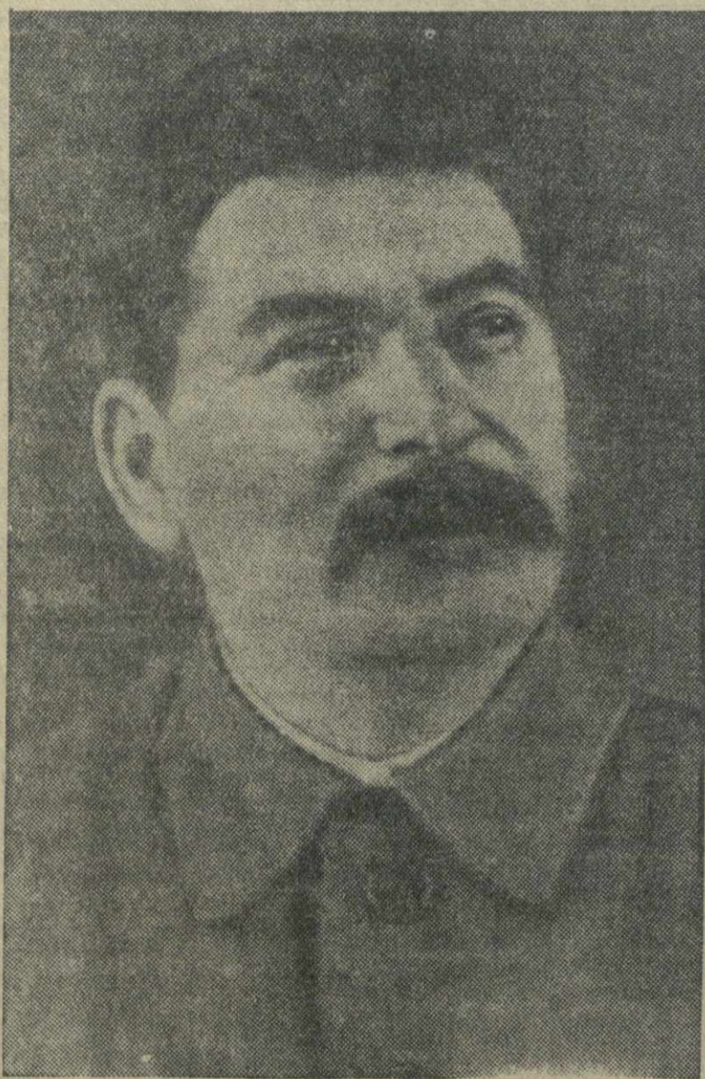
СТАЛИН И. В.