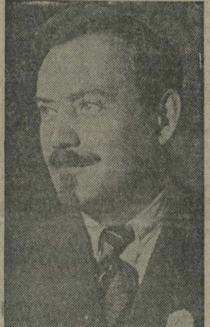
Булганин Н. А.