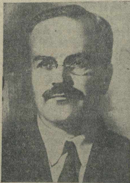
Молотов В. М.