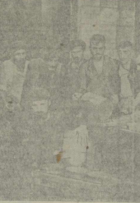
Первая картина 1 акта пьесы «Из искры» в постановке театра имени К. Марджанишвили. На снимке: «Бидонный цех». (Груз. театр Союзфото).