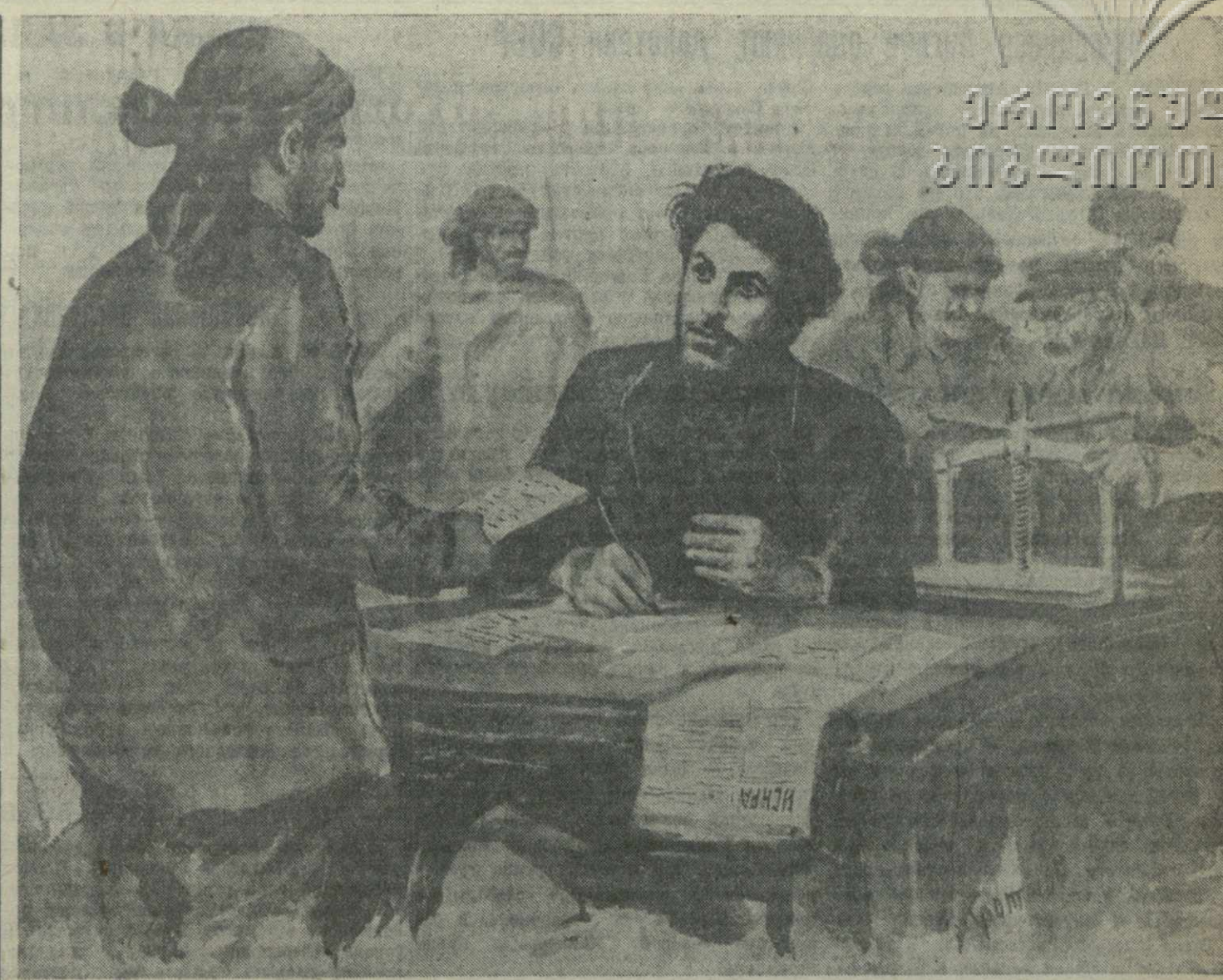
Товарищ СТАЛИН в батумском подполье пишет прокламацию о рабочей демонстрации 9 марта 1902 г. Рис. художника В. Кроцкого.