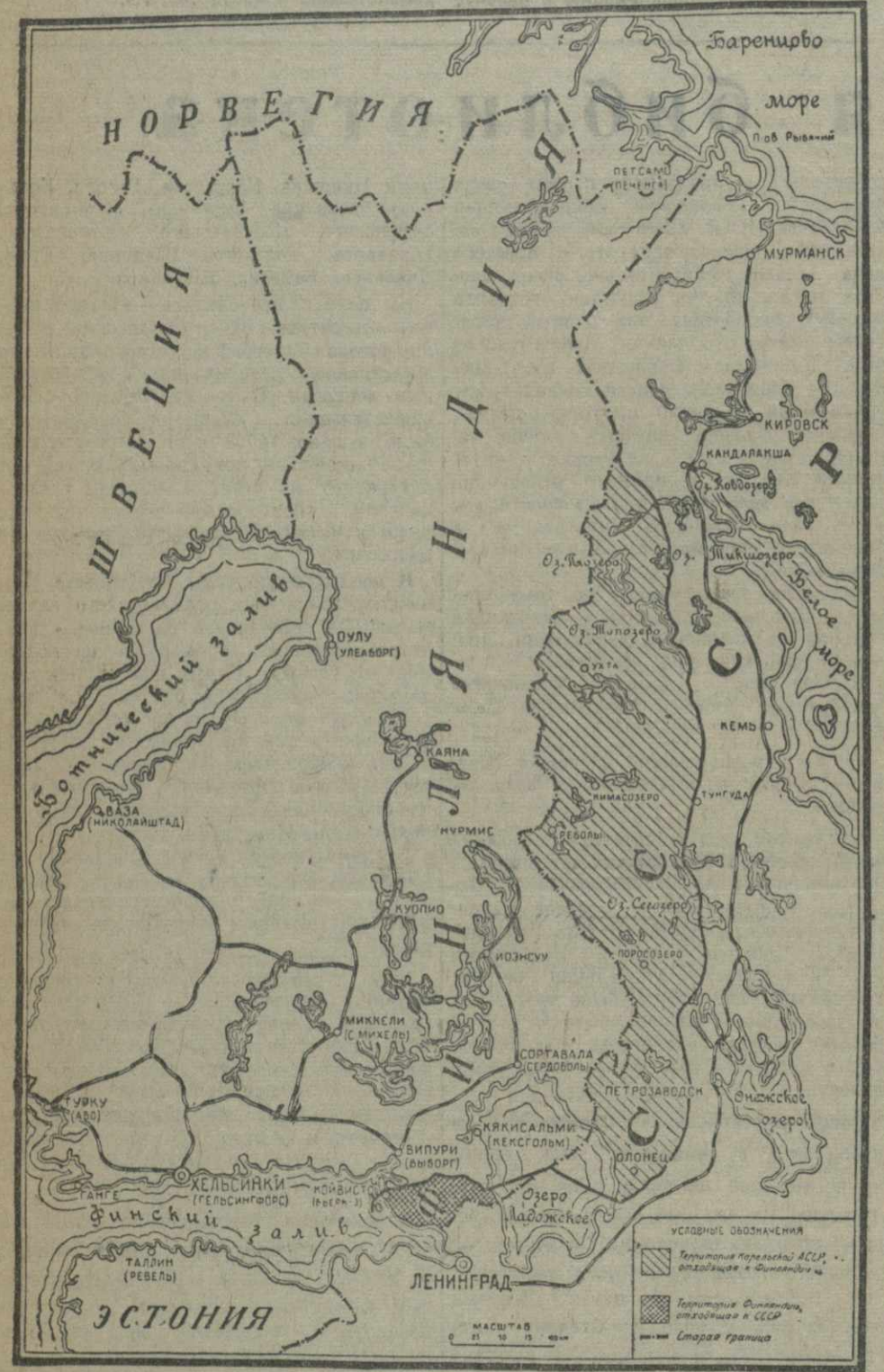
2 декабря 1939 года в Москве заключен договор о взаимопомощи и дружбе между Советским Союзом и Финляндской демократической республикой. На снимке: карта границ между СССР и Финляндской демократической республикой.