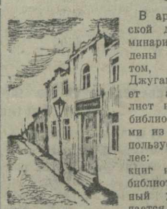
Старый Тифлис. Рисован Н. Турко.

В архиве тифлисской духовной семинарии были найдены доносения о том, что Иосиф Джугашвили «имеет абонементный лист из «Дашевской библиотеки», книга из которой он пользуется». И далее: «В чтении книг из «Дашевской библиотеки» названный ученик замечается уже в 13-й раз».