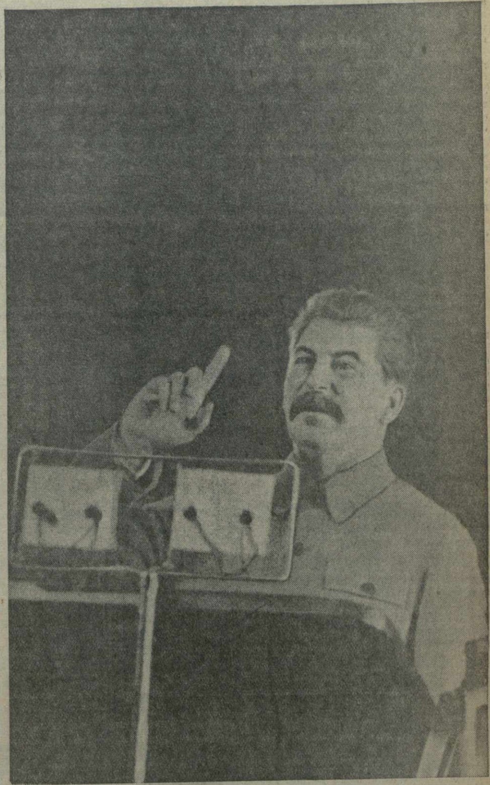
«Депутат должен знать, что он слуга народа, его посланец в Верховный Совет и он должен вести себя по линии, по которой ему дан наказ народом.»

Руководство всеми операциями по выводу «Седова» из льдов правительством Союза ССР возложено на начальника Главного управления Северного морского пути при Совнаркоме СССР тов. И. Д. Папанова.