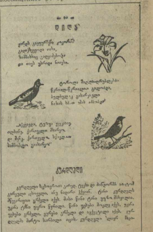
Страница из старого начального грузинского учебника «Деда-зна» («Родной язык»), на которой помещено стихотворение «Утро».