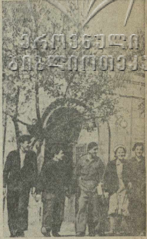
Гори. Учащиеся сельскохозяйственной техникумы имени Сталина перед зданием бывшего духовного училища, в котором учился товарищ Сталин.

В центральном Китае Китайские войска продолжают наступление в ряде районов, расположенных южнее реки Янцзы. Продвижение китайских частей происходит особенно успешно на севере провинции Хунань, в южной части провинции Хубэй, провинциях Цзяньси, Аньхуэй и Чжэньцзян. В секторе Суйчжоу — Иппань (северо-западнее Ханькоу) китайские части выбили японцев из нескольких пунктов. В районе Иппань — Аньлу японцы сосредоточили около 10.000 солдат. На юге провинции Хунань кровопролитные бои происходят в районе станции Чантайгуань, в 30 км севернее Синьяна. В район южнее Синьяна японское командование перебрасывает подкрепления, готовясь к контрнаступлению. В северной части провинции Хунань переломные китайские части прорвали линию японской обороны севернее Нюжюу. В провинции Цзяньси бои происходят в районе Наньчаля и Уния. По сведениям газеты „Шуньбао“, 17 декабря на Шанхай — Нанкинской дороге, близ станции Банью, взорван японский поезд Паровоз и 6 вагонов серьезно повреждены. (ТАСС.)