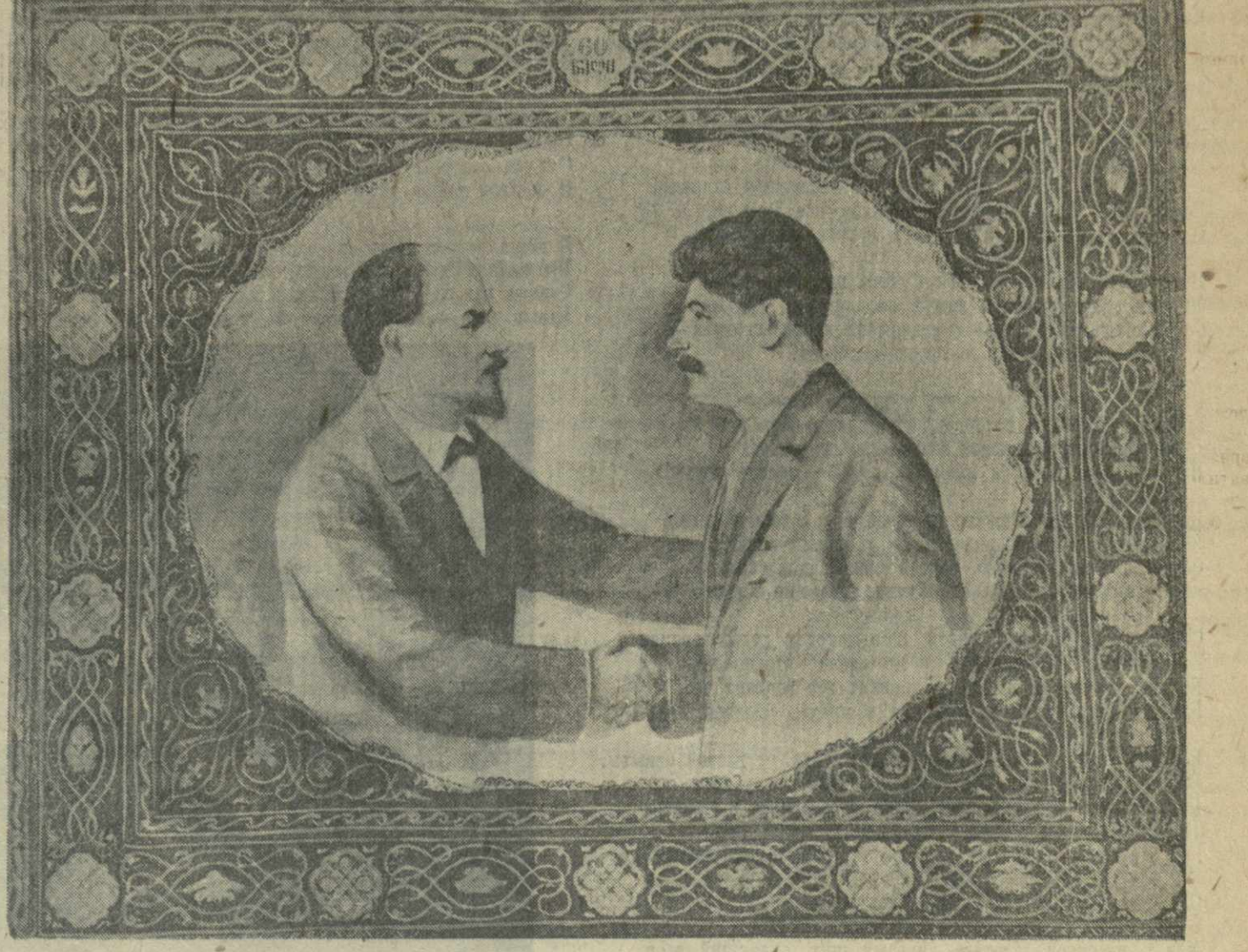
К 60-летию со дня рождения великого вождя народов товарища СТАЛИНА, в Тбилиси, под руководством художественно-экспериментальных мастерских Дома народного творчества выткан ковер, представляющий замечательное произведение искусства ковроткачества. В центре ковра, в большом овале изображена историческая встреча в Таммерфорсе великих вождей пролетарской революции ЛЕНИНА и СТАЛИНА. Овал обрамлен большой каймой в грузинском стиле с шелковыми медальонами. Прияга для ковра изготовлена из тонкорунной шерсти. В овале 19 оттенков тона сели, в кайме свыше 20 тонов.