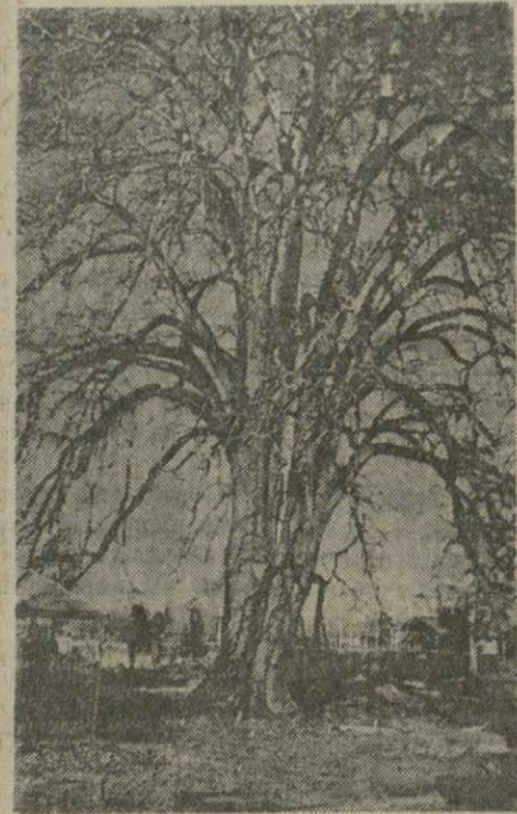
Дерево в центре селения Сакулия (Нутаинский район), под которым товарищ СТАЛИН в 1905 году проводил митинг крестьян.

Сегодня в селе Сакулия, рядом с колхозным клубом, у столетнего дуба, будет торжественно установлена скульптурная фигура творца счастливой и радостной жизни народов СССР, нашего любимого вождя и учителя великого Сталина. Скульптура устанавливается на том месте, где 35 лет назад молодой Сталин выступал на митинге крестьян нашего села, где пламенно звучали его вдохновенные слова, призывавшие крестьян к борьбе против царизма, против помещиков, князей и дворян.