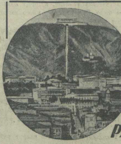
Тбилиси. Вид на фуникулер.