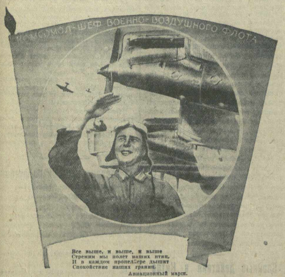
Все выше, и выше, и выше. Стремимся полет выше птиц. И в каждом пролете бережно дышим. Спокойствие наших границ. Авиационный марш.