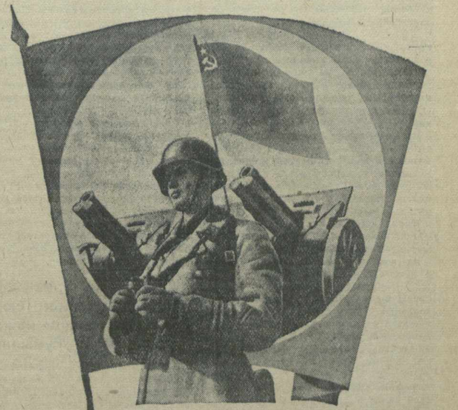
Для защиты свободы и мира. Есть гранаты, готова пилка.