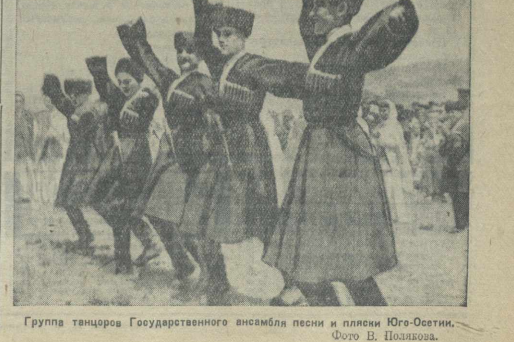
Группа танцоров Государственного ансамбля песни и пляски Юго-Осетии.