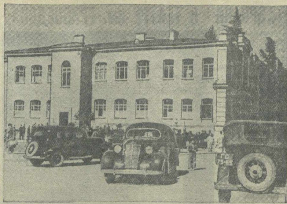
Кутайси. У здания Индустриального техникума.

По общим докладом пленум принял практические мероприятия.