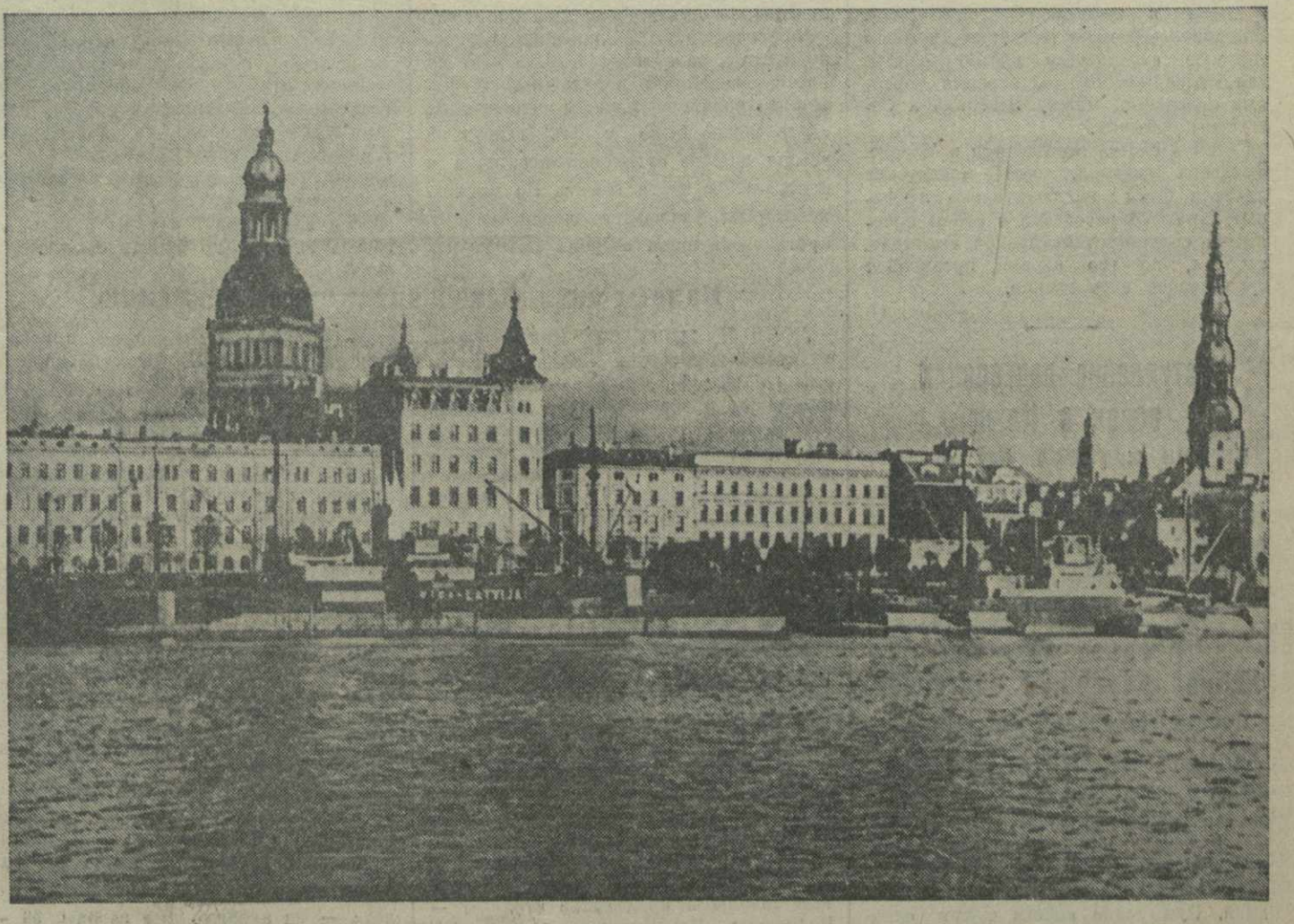
Города Советской Прибалтики. На снимке: набережная в г. Рига.

Проведен посев озимых на участках лучших научно-исследовательских институтов и селекционных станций страны. На этих участках будут показаны новые сорта сельскохозяйственных растений, созданные Всесоюзным институтом зернового хозяйства юго-востока СССР, Сибирским институтом зернового хозяйства, Краснодарской, Шатловской, Харьковской и другими селекционными станциями. (ТАСС).