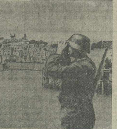
Порт св. Петра на острове Герзии (у пролива Ла-Манш), оккупированный немецкими войсками.