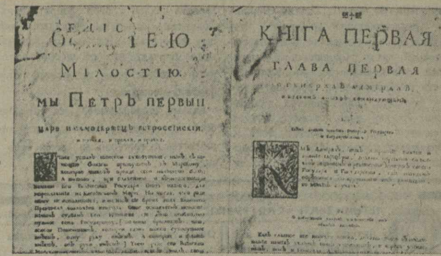
Государственный исторический музей приобрел редчайший экземпляр морского устава, выпущенного при Петре I в 1720 г. На снимке: репродукция с первых листов предисловия и первой книги морского устава. Репродукция Г. Шипрова. Фото ТАСС.