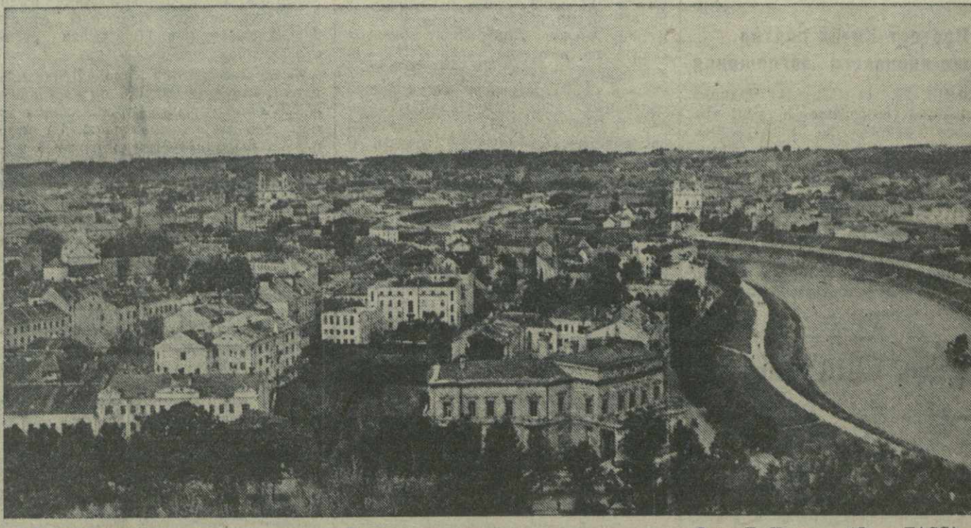
Города Литовской ССР. На снимке: г. Вильнюс.

Косовища хлебов в подавляющем большинстве районов закончились. На 20 сентября по Союзу скошено 83.578 тысяч гектаров колосовых — на 1.513 тысяч гектаров больше, чем было к этому же времени в прошлом году. План выполнен на 97,5 процента. (ТАСС).