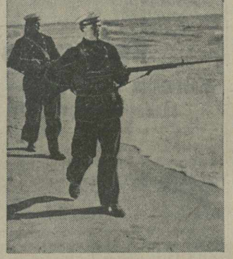
Северо-западной границе. На снимке: на отрядах морских границ. Фотохуд. М. Редина. Фото ТАСС.