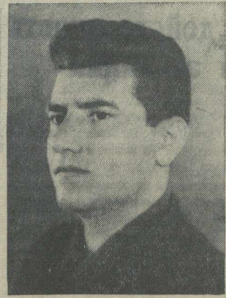
самостоятельности в комсомольской работе.