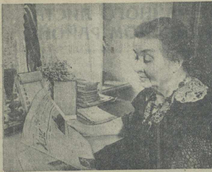
В городе Вильнюс (Литовская ССР) живет сестра Феликса Эдмундовича Дзержинского...