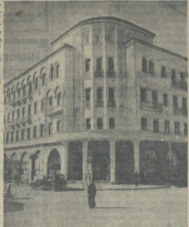
Кутаиси. Новое здание гостиницы «Кутаиси», сданной в эксплуатацию 15 сентября 1940 г.

Г. НАРСИЯ, секретарь Кутаисского городского комитета КП(б) Грузии.