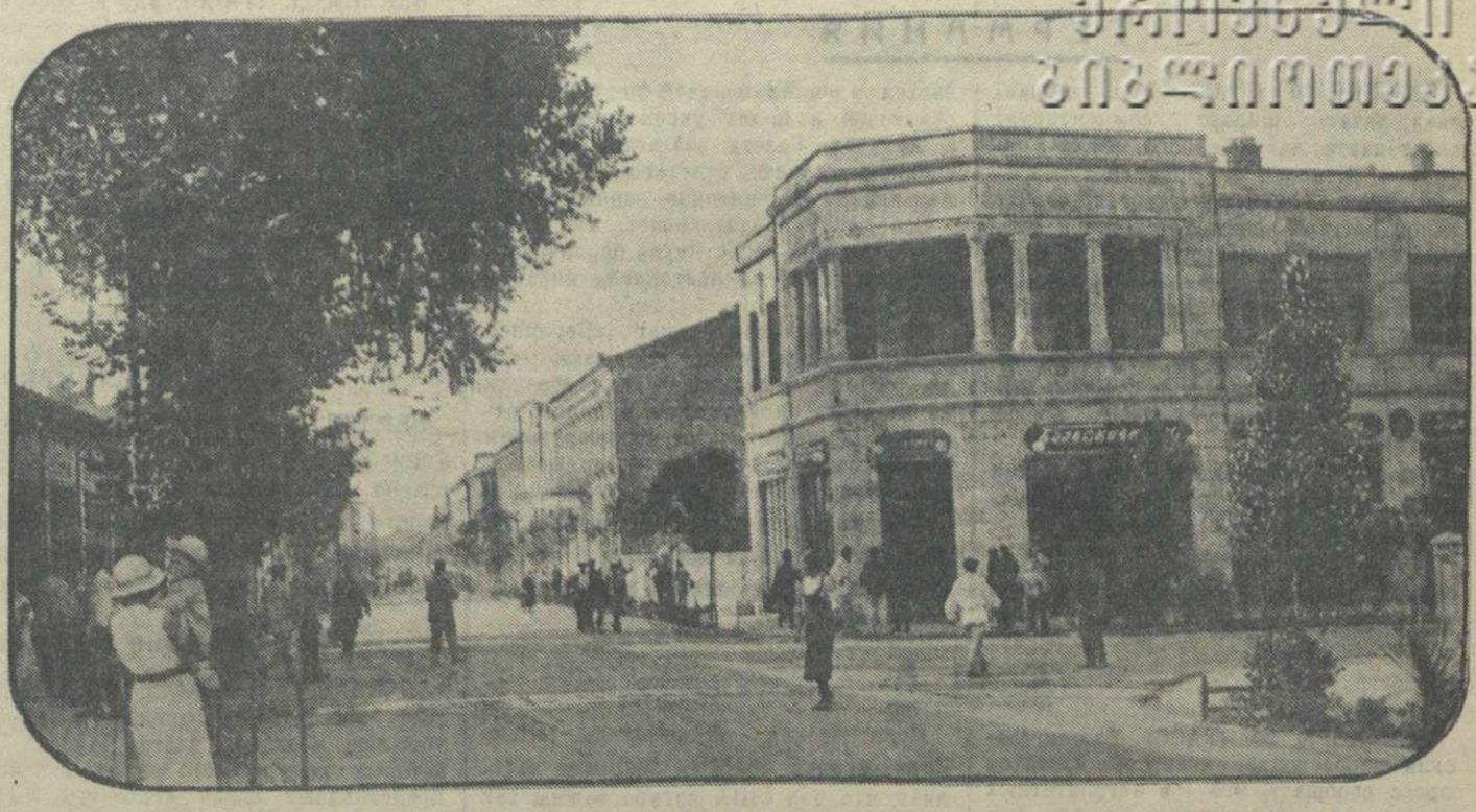
Кутаиси. Улица Акакия Церетели.