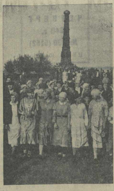
На Куликовом поле (Куркинский район, Тульской области) состоялся массовый митинг и большое народное гуляние, посвященное 560-летию Куликовской битвы. На митинге присутствовало свыше 5 тысяч колхозников. На снимке: у памятника о Куликовской битве.