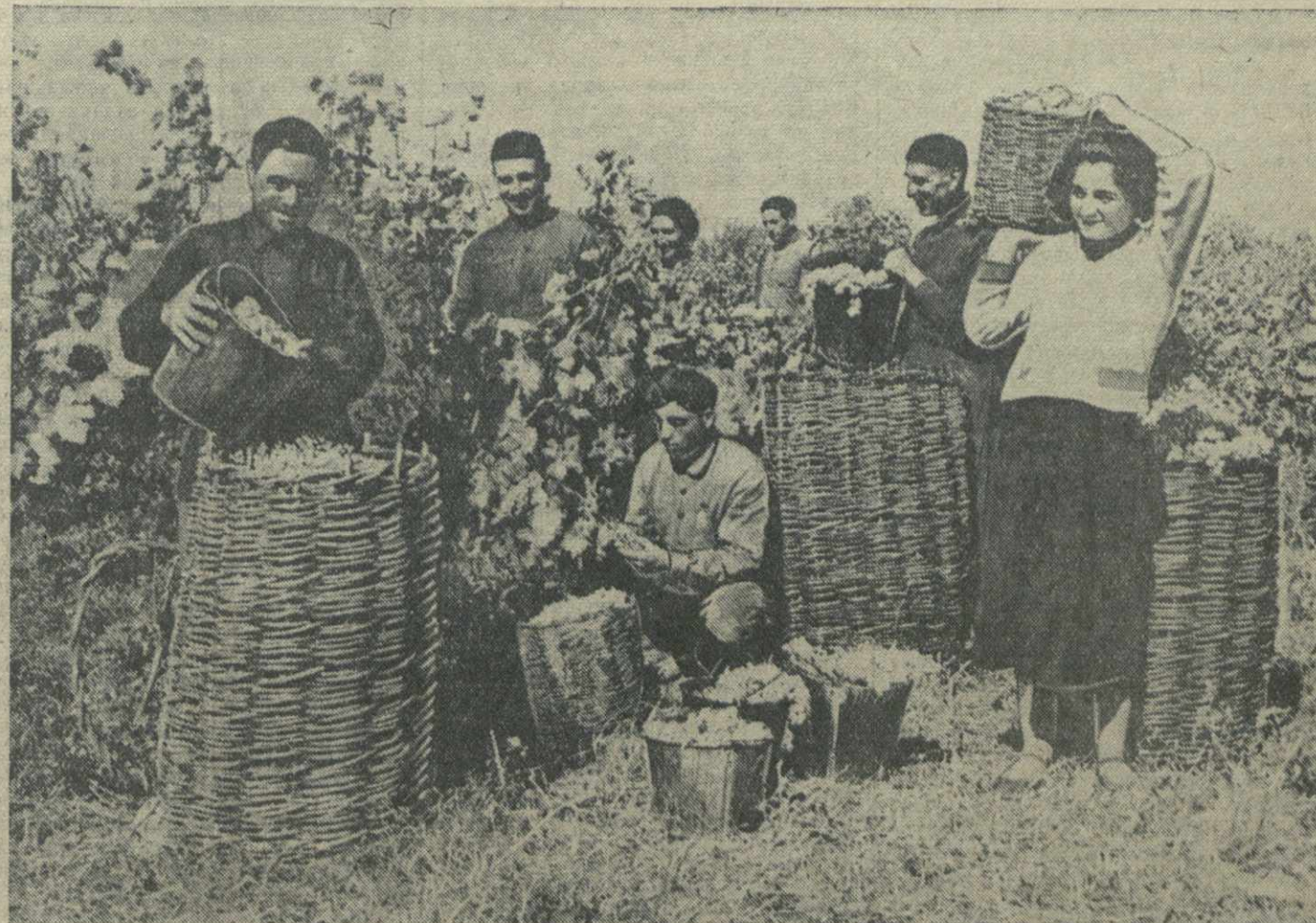
Сбор винограда в колхозе «Цители марани», сел. Нарданахи, Гурджаанского района.

ОТДЕЛ ПРОПАГАНДЫ И АГИТАЦИИ ЦК КП(б) ГРУЗИИ.