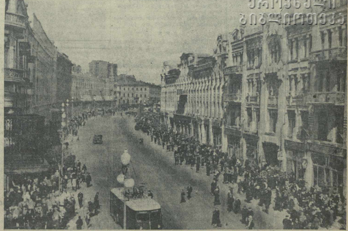
Столица Украинской ССР — Киев. На главной улице — Крещатике.

Колхозники сел. Шрома с огромной радостью встретили сообщение о том, что трудящиеся Украины приглашают делегацию трудящихся Грузии для поведения итогов борьбы за выполнение обязательств соревнования рабочих, колхозников, интеллигенции братских республик. Они приступили к проверке выполнения договора соревнования, готовятся к тому, чтобы сообщить колхозникам братской Украины о своих успехах и достижениях.