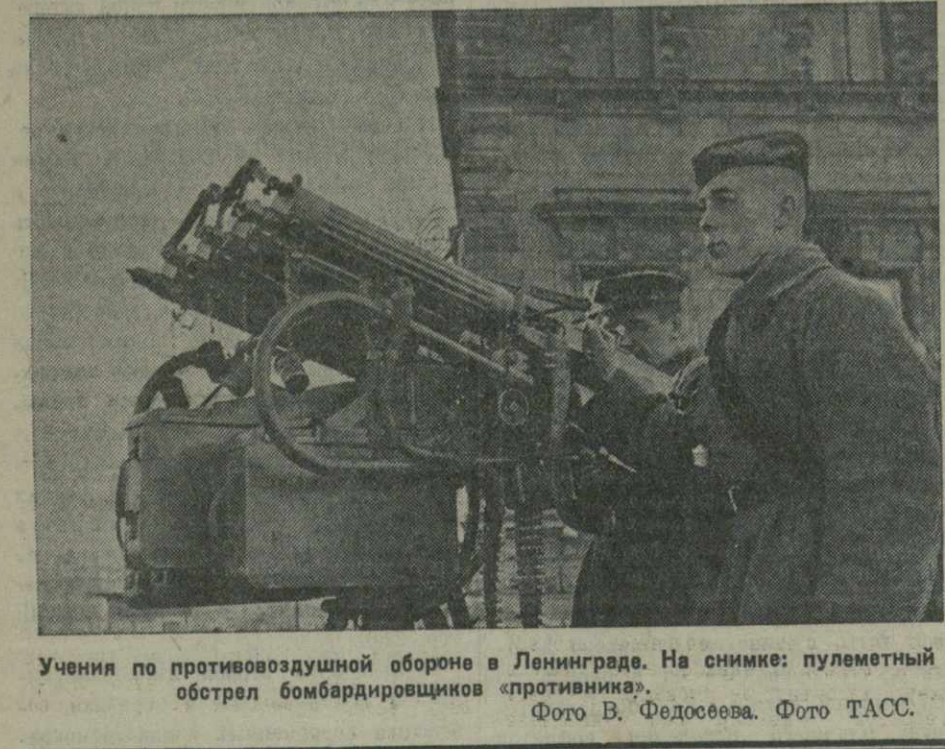
Учения по противовоздушной обороне в Ленинграде. На снимке: пулеметный обстрел бомбардировщиков «противника».

18 октября, в 8 час. 30 мин. вечера, по Дворцу писателей состоится собрание актива союза советских писателей Грузии.