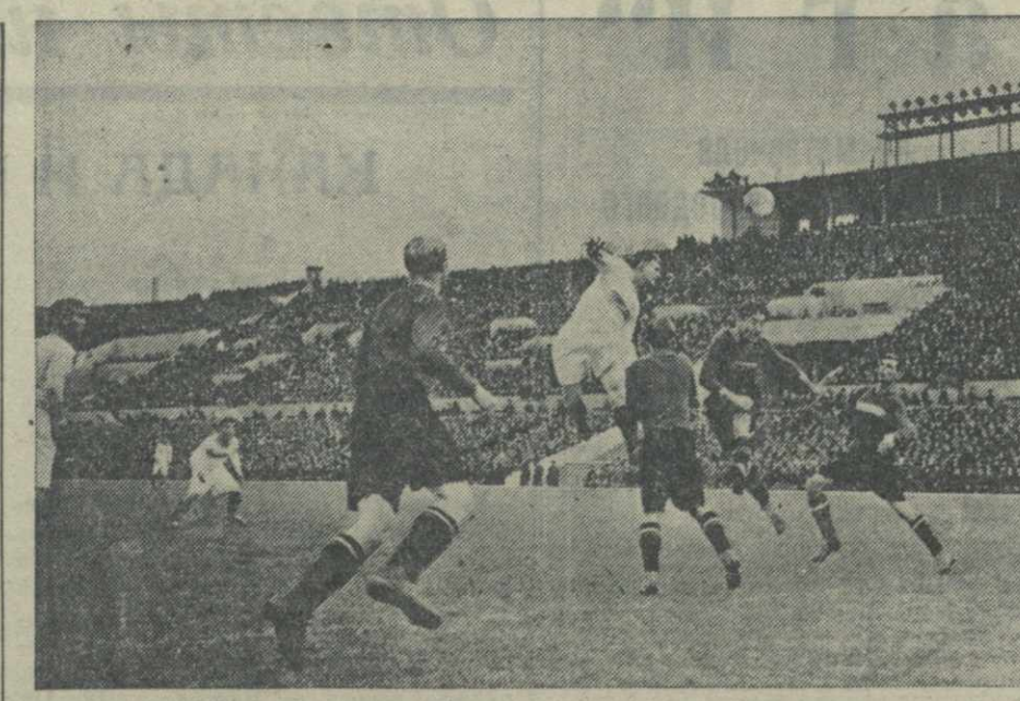
13 октября на стадионе «Динамо» (Москва) состоялся футбольный матч на первенство СССР 1940 года между командами «Динамо» (Тбилиси) — «Спартак» (Москва). Победитель матча — команда «Динамо». На снимке: момент игры.

В крупных городах и промышленных центрах Союза организованы предпраздничные ярмарки, которые располагаются преимущественно на колхозных рынках. К участию в них широко привлекаются колхозы и колхозники. Наркомат торговли СССР предложил своим местным органам помогать колхозам в доставке сельскохозяйственных продуктов на рынки.