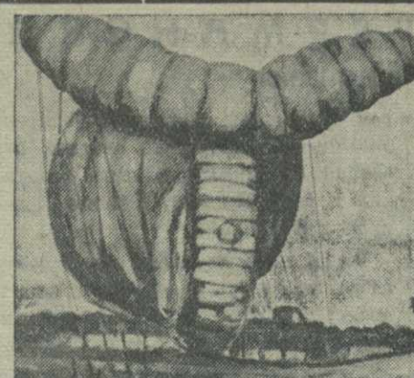
Как сообщало недавно Германское информационное бюро, несколько отравившихся английских баллонов воздушного заграждения снова пришлось вострому к Дании со стороны Северного моря.

Крупная забастовка венгерских шахтеров. Вспыхнула крупная забастовка, которая парализовала почти две трети венгерской угольной промышленности.