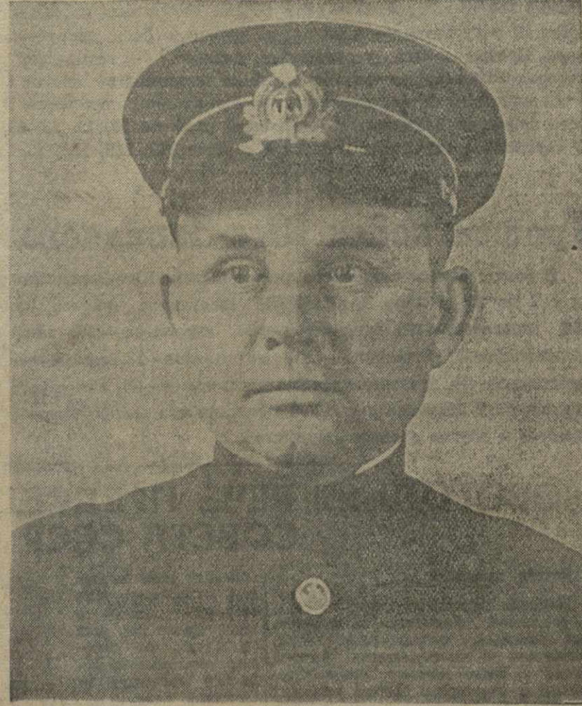
Вице-адмирал Ф. С. ОКТЯБРЬСКИЙ