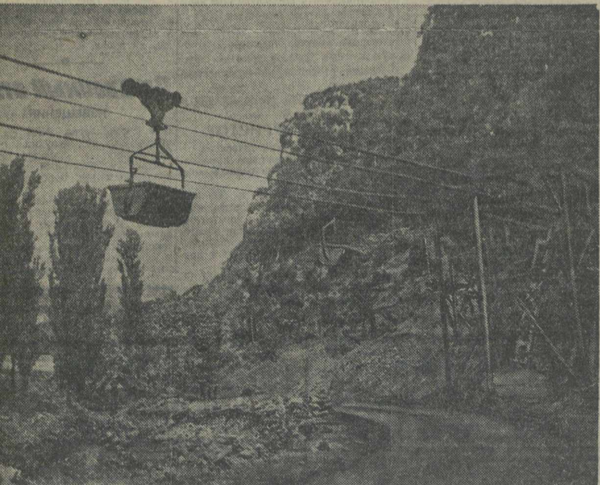
Новая дорога на Чистурских рудниках.

полным удовлетворением встретили решение правительства о выпуске займа укрепления обороны СССР.