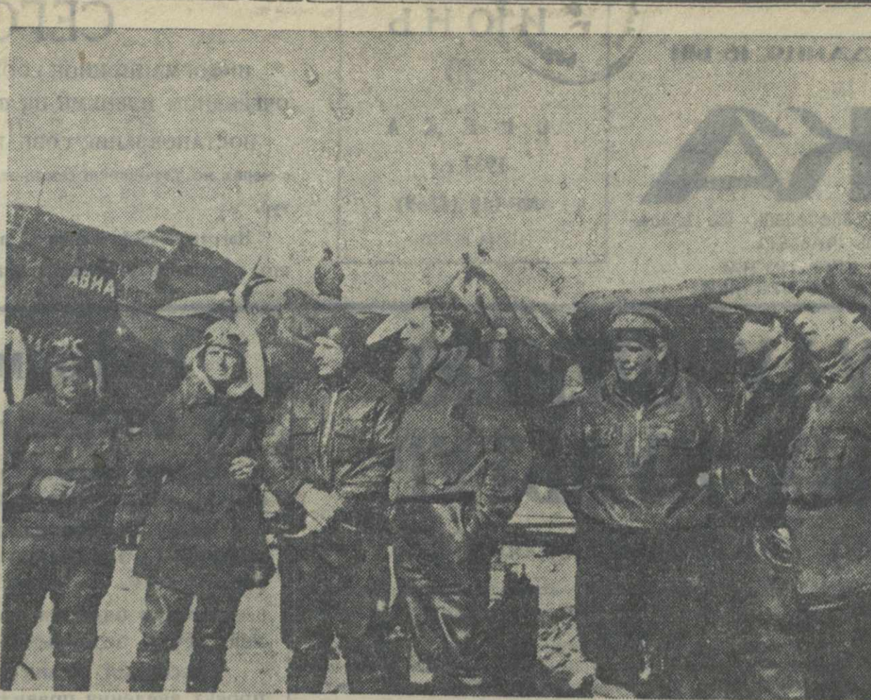
Участники экспедиции на Северный полюс: слева направо: герои Советского Союза гг. Спирин, Шведлов, Бабушкин, Шмидт, Водопьянов, Алексеев, Молоков, Сокофатов.

ЦК КП(б) Грузии утвердил также постановление Наркомзема Грузии.