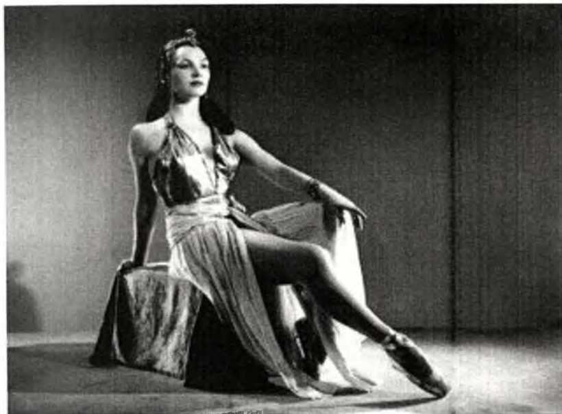
ფრანგული ბალეტის ვარსკვლავი ეთერ ფაღავა