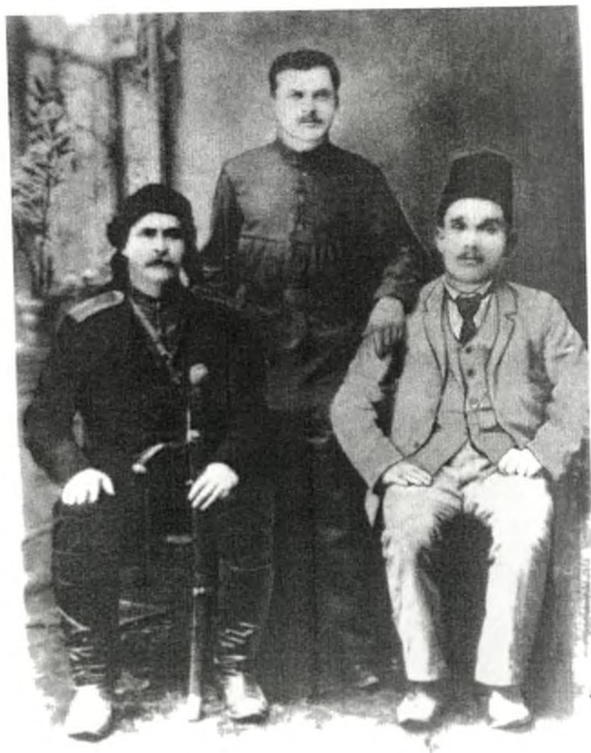
აჭარელი ფალაუების ჯგუფი