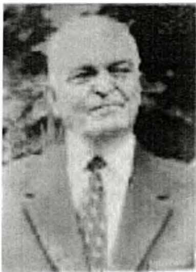
მწერალი იუსუფ ფაღავეა