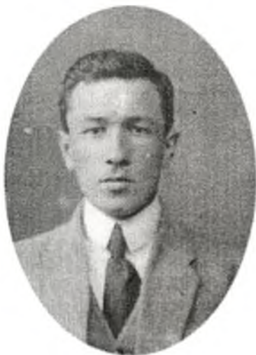
გოგიტა ჯალაღვა, პოლიტიკური მოღვაწე