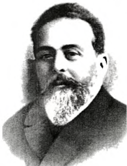
მეკი ფაღავა, ცნობილი იურისტი და საზოგადო მოღვაწე