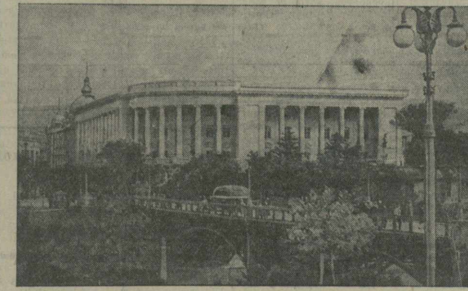
К XXIII годовщине Октябрьской Социалистической революции в Тбилиси, на ул. Жоржеса заканчивается постройка здания Дворца книги. На снимке: общий вид Дворца книги.

Подробный отчет о собрании будет дан в одном из ближайших номеров газеты.