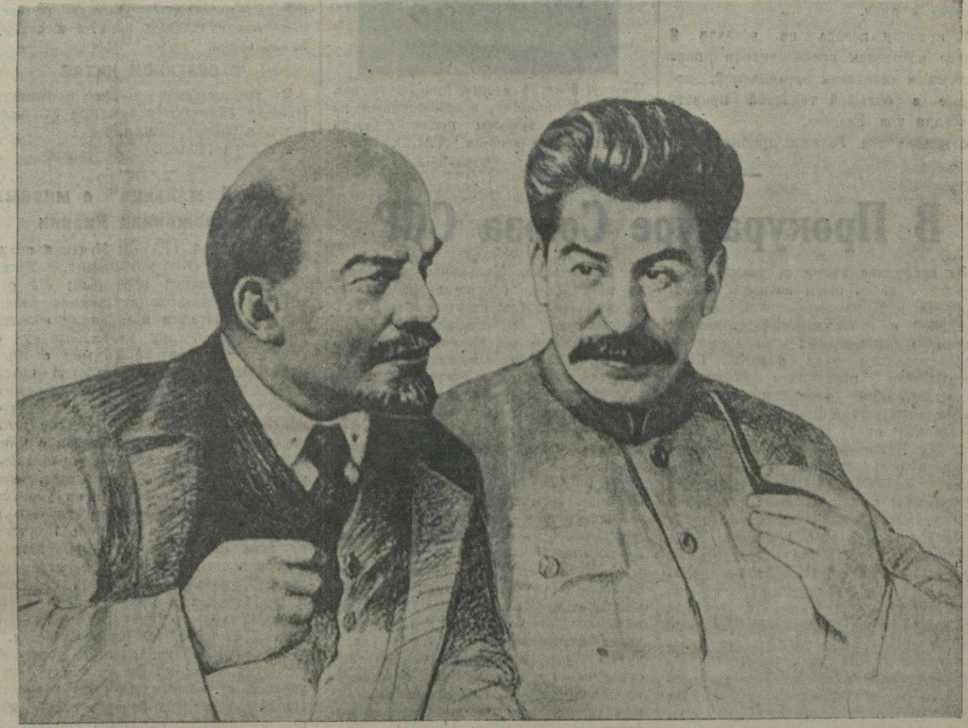
В. И. ЛЕНИН и И. В. СТАЛИН. Рисунок художника П. Васильева.

Медалью «За трудовое отличие» награждены 3 человека. (ТАСС).