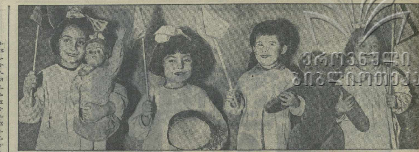
В тбилисском 69-м детском саду отдела народного образования районного Совета Сталинского района. На снимке: воспитанники детского сада готовятся к Октябрьским праздникам.

★ Сборник избранных стихотворений и поэм поэта Алио Мамашвили выпущен издательством «Федерация». В книге 300 страниц.