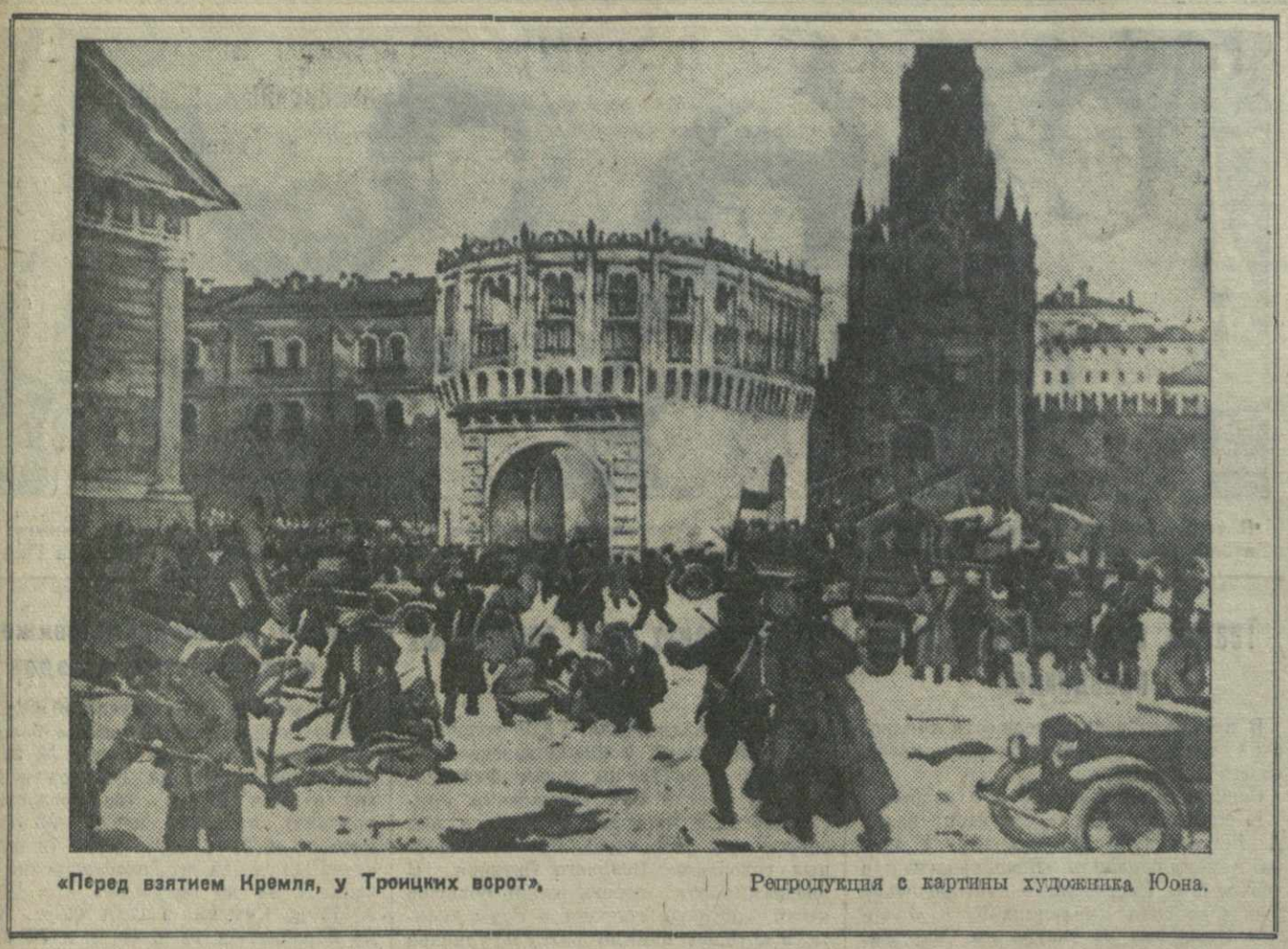
«Перед взятием Кремля, у Троицких ворот,» Репродукция с картины художника Юона.

Работа фабричного комитета признана удовлетворительной.