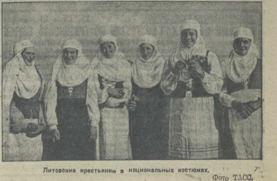
Литовские крестьянки в национальных костюмах.

Что ж, мы держим народ в мобилизационной готовности! Никому не будет позволено посягнуть на священные рубежи социалистического государства. А если враг суеверен, вот тогда мы двинем в ответ всю накопленную годами мощь!.. Выпавшие рукими рабочего класса СССР оружие решит споры. Мы сумели победить в 1917—1921 годах. Мы победим и в грядущих боях.