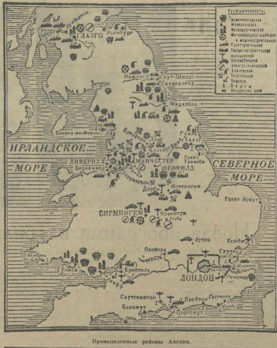
Промышленные районы Англии.

демократ Коке заявил, что последняя речь Рузвельта равновесила «объявление войны». Дальнейшая помощь Англии, сказал он, означала бы, что США «принимают активное участие в войне». Другой член палаты представителей республиканец Финн выступил против заявления Кока и одобрил речь президента.