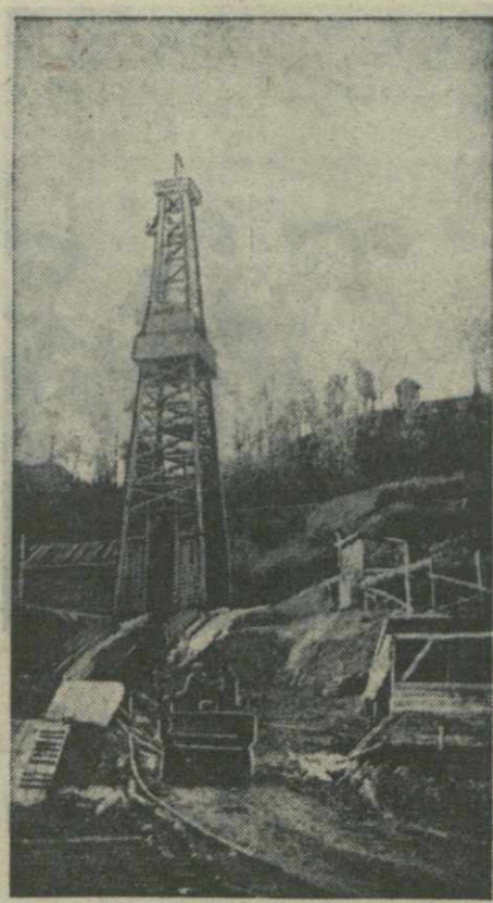
Супсинское месторождение нефти. Буровой № 3.