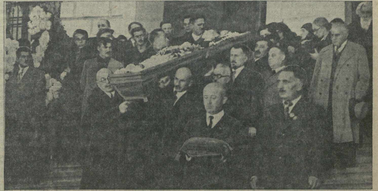
Вынос гроба с телом покойного академика И. А. Джавахишвили из здания Государственного университета.

Рационализация и сокращение административно-управленческого аппарата промышленности сохраняет государству большие денежные средства. И в то же время руководство предприятиями станет более гибким и оперативным, отчетов наша промышленность только выиграет.