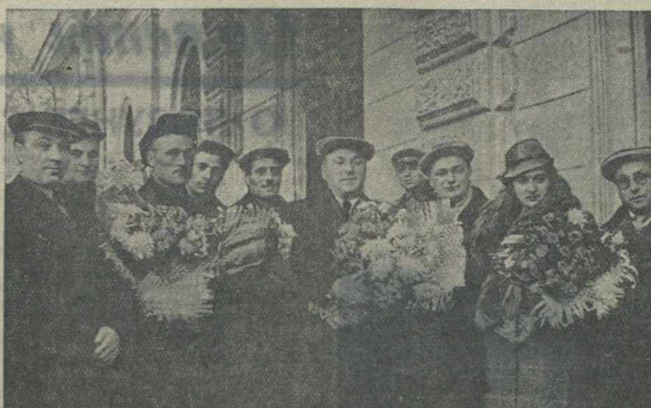
Группа участников делегации трудящихся Грузии среди руководителей партийных и советских организаций города Одессы.