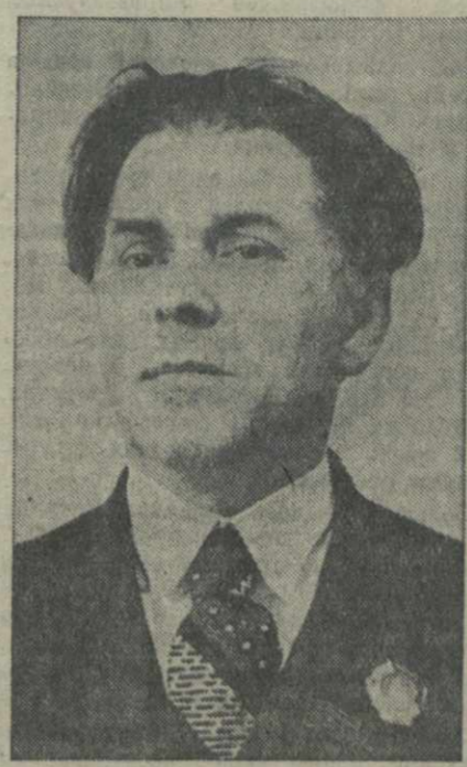
Великая Октябрьская Социалистическая революция, осуществившая заветные мечты народа, принесла осуществление и мечтам поэта. Его первая книга «Солнечные зарницы» вышла в 1913 году и содержала в себе дооктябрьские и послеоctбрьские стихи — это гневный протест поэта против тех, кто вверг миллионы людей в империалистическую войну; это возмущенное ожидание грозы, которая опустошитным ливнем пройдет над уставшей землей; это песни радости обывших светлых надежд, песни о весне освобожденных народов.

Сегодня общественность Советского Союза отмечает 50-летие со дня рождения и 30-летие творческой деятельности выдающегося представителя советской украинской поэзии Павло Григорьевича Тычины.