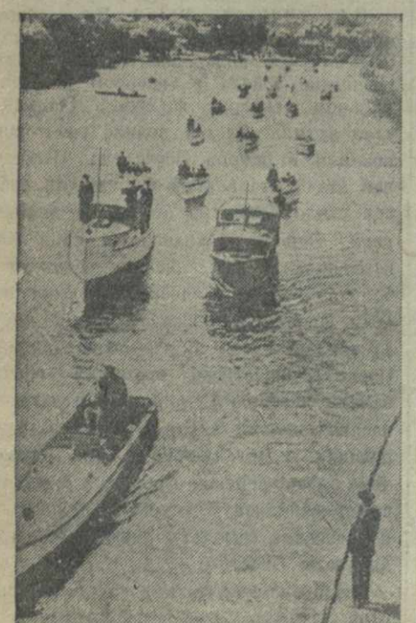
Флотилия английских торпедных катеров, охраняющих воды Темзы.

(для удовлетворения нормальных нужд требуется в течение 6 месяцев 1.200 тысяч тонн); кукурузы — 400 тысяч тонн (нормальная потребность 1 млн. тонн); ячменя — 210 тысяч тонн (нормальная потребность 350 тысяч тонн). Засыпая пшеницы составляет 900 тысяч тонн, тогда как нормальная потребность составляет 1.950 тысяч тонн.