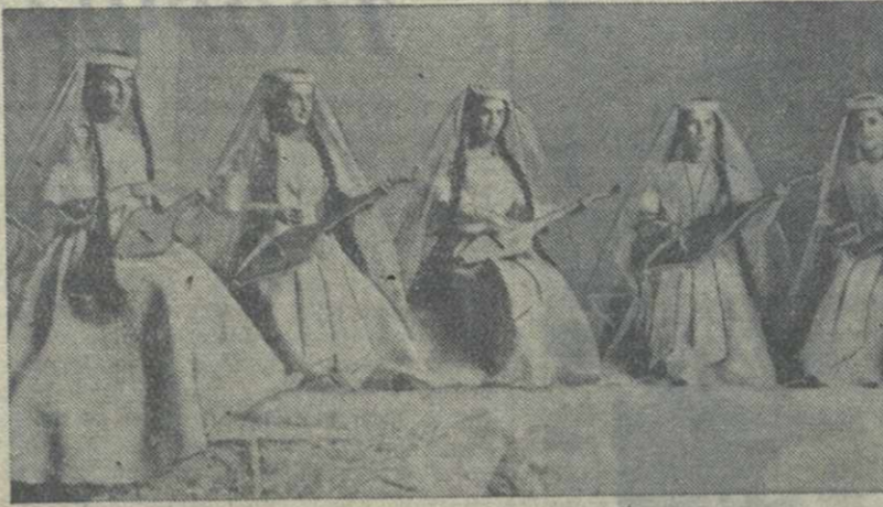
Музей игрушки. Музыкальная игрушка «Ансамбль чонгуристов».