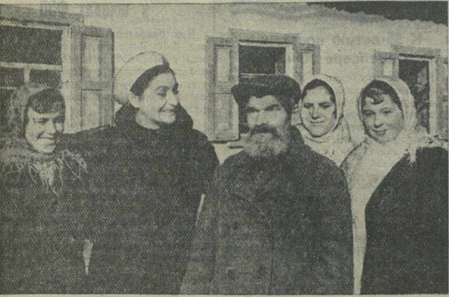
Группа делегатов трудящихся Грузии посетила колхоз им. Чапана...