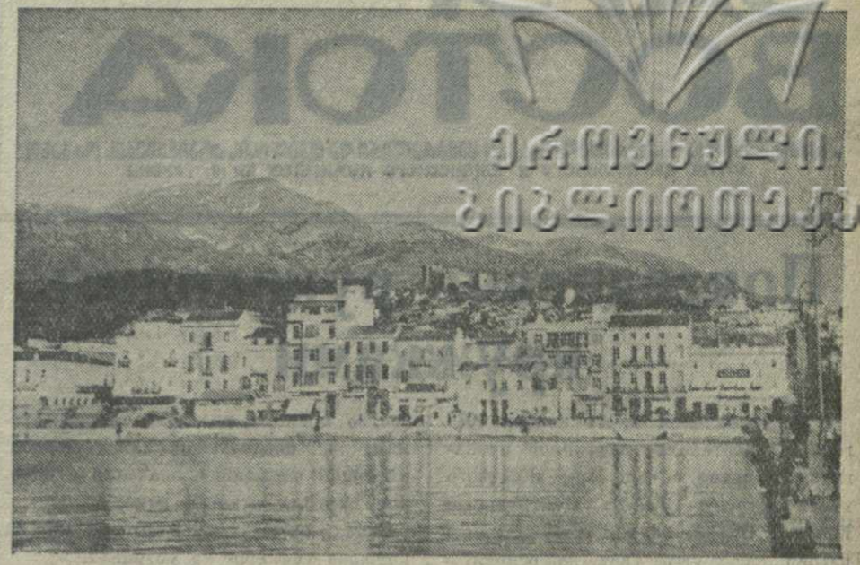
Город Патрас (Греция), недавно подвергшийся бомбардировке итальянскими самолетами.

ЛОНДОН, 28. (ТАСС). Английские газеты на видном месте помещают сообщение о том, что самолет, на котором летел Кьян, сбит.