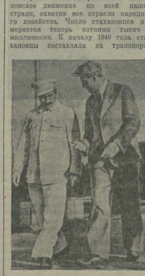
Л. М. КАГАНОВИЧ и А. Г. СТАХАНОВ (1938 г.).