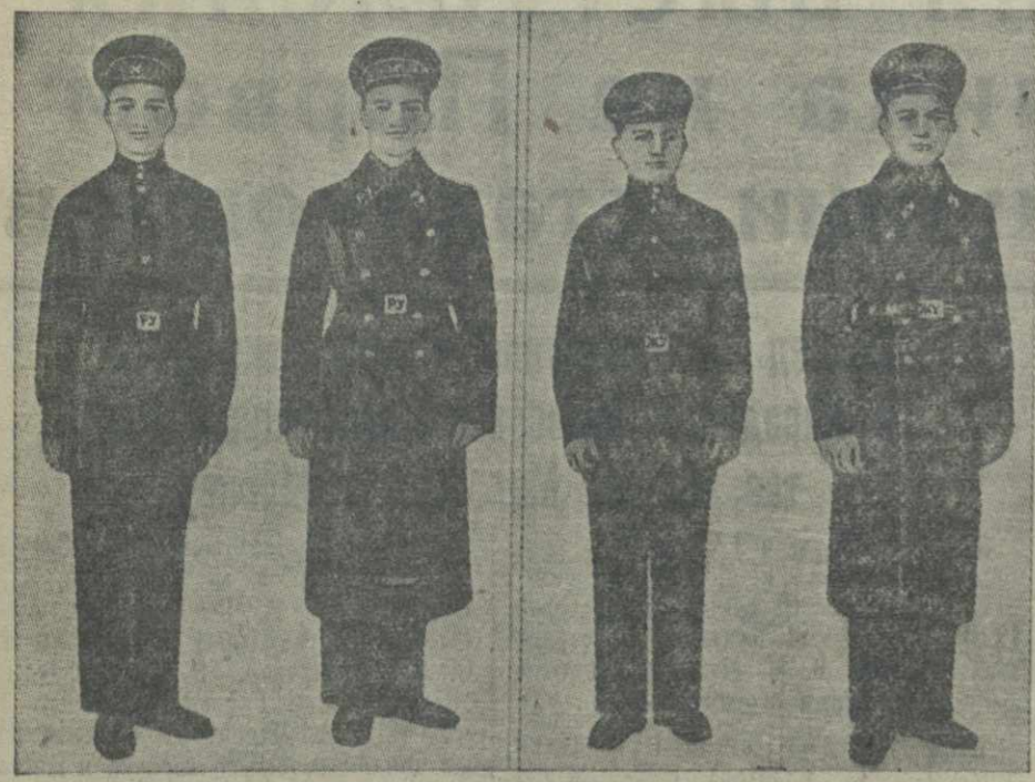
Форма одежды учащихся ремесленных училищ