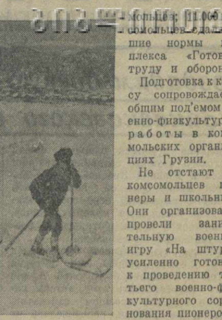
Бакуриани. Школьники на лыжной тренировке.

По неполным данным, на 25 января 1941 года в Грузии создано 19.000 команд, охватывающих 95.000 комсомольцев.