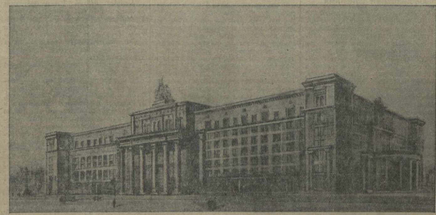
Проект сооружаемого в Москве здания Академии наук СССР. Автор проекта — академик архитектуры А. Шусов.

Совнарком СССР назначил тов. Урюпина Ф. А. заместителем народного комиссара финансов СССР и ввел его в состав коллегии Народного Комиссариата Финансов СССР.