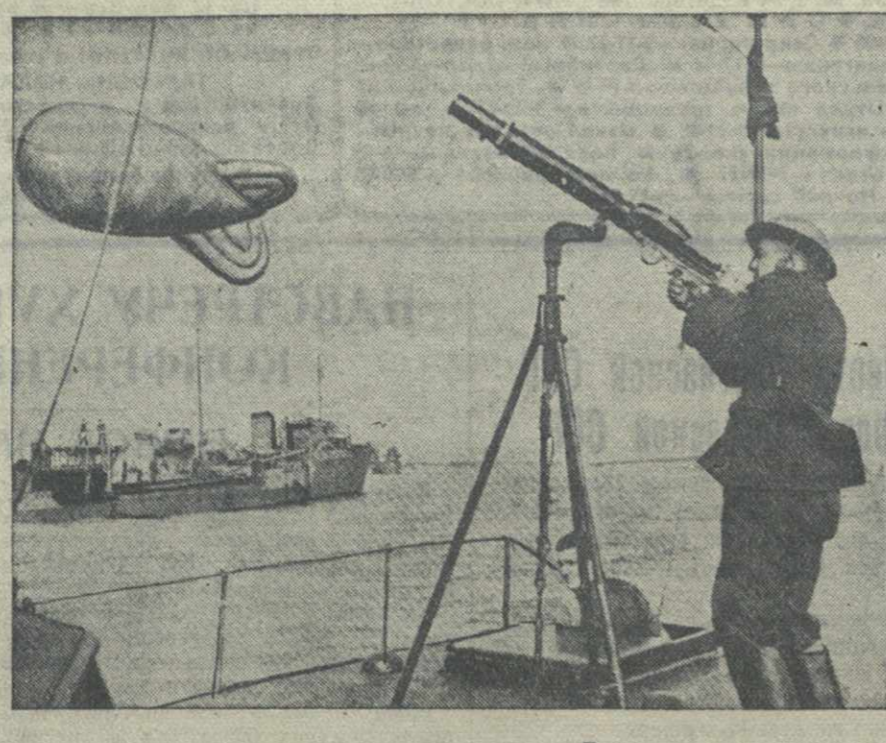
Баллон воздушного ограждения и пулемет «Люис» на конвоируемых английских кораблях.

БЕРЛИН, 1. (ТАСС). Германская газета «Дейче бергверкдейтунг» пишет о тяжелом экономическом положении Франции. Количество безработных во Франции составляет в настоящее время около 2 млн. человек. В мирное время в автомобильной промышленности было занято около 100 тыс. человек. Сейчас, несмотря на то, что французская автомобильная промышленность переключилась на производство автомашин, работающих на древесном газе, в ней занято только 45 тыс. человек.