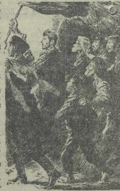
Из иллюстраций В. Щеглова к книжке О. Иваненко «Скоро взойдет солнце»

«И я знаю, что не согласен, — добавил Сосо. — Но все же пусть это будет стоять в конце наших требований. Не думайте, что это уж так много, это — право даже животного».