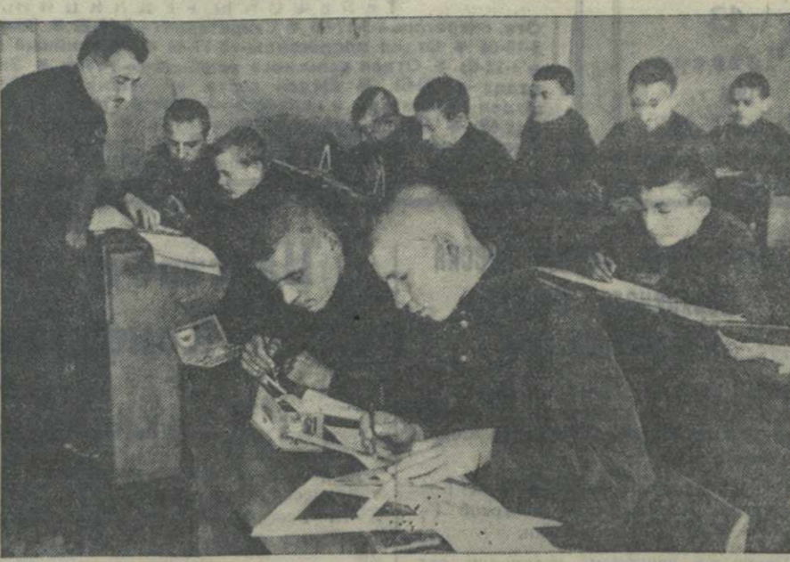
На уроке черчения в 7-й тонарной группе Тбилисского ремесленного училища № 3.

НЬЮ-ЙОРК, 11. (ТАСС). Агентство Юнайтед пресс сообщает, что представителем правительства заявили, что в январе в США произведено около 1.000 самолетов, из них примерно 250 учебных. Январское производство самолетов соответствовало плану.