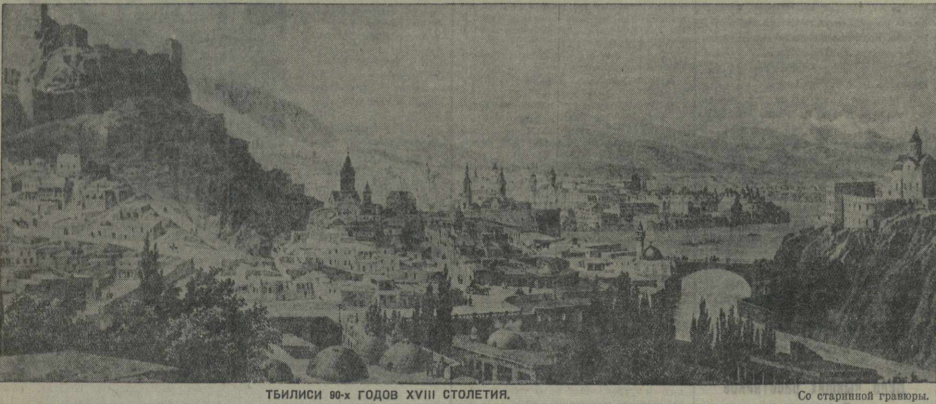
ТБИЛИСИ 90-х ГОДОВ XVIII СТОЛЕТИЯ.

Свыше 200 комсомольцев — участников кросса — сдали нормы на значки «Готов к труду и обороне I и II ступени».