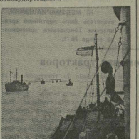
Караван английских конвоируемых кораблей.

БЕРЛИН, 11. (ТАСС). Германское информационное бюро, опровергая утверждение английского премьера Черчилля в его последней речи по радио, что из 150 германских пикирующих бомбардировщиков, атаковавших в последнее время Мальту, уничтожено якобы не менее 90 самолетов, заявляет, что в районе Средиземного моря германская авиация потеряла всего 11 самолетов, из них 6 пикирующих бомбардировщиков.