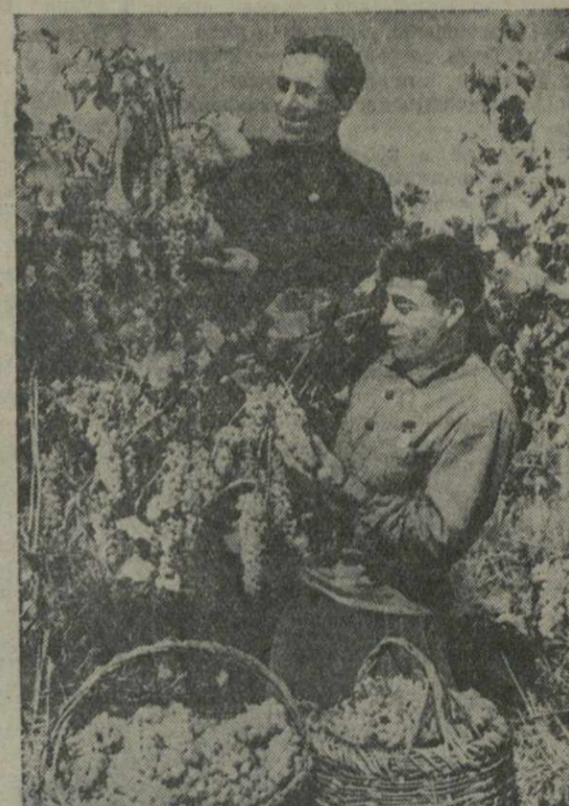
На сборе винограда в колхозе «Цители марали», сел. Нарданахи, Гурджаанского района.

Значительно повысилось качество продукции предприятий Самтреста. Это — результат улучшения техники прием.