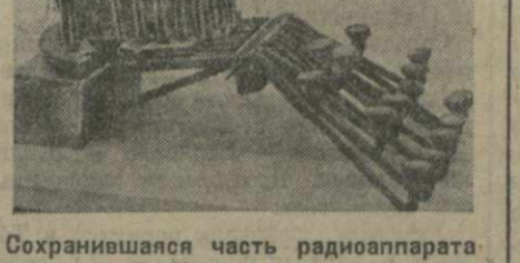
Сохранившаяся часть радиоприбора Г. Нахучишвили.

Из всего этого можно заключить, что Г. Нахучишвили, хотя и позже