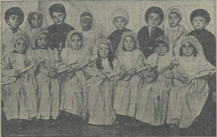
В детском саду Тбилисского трамвайно-троллейбусного управления...