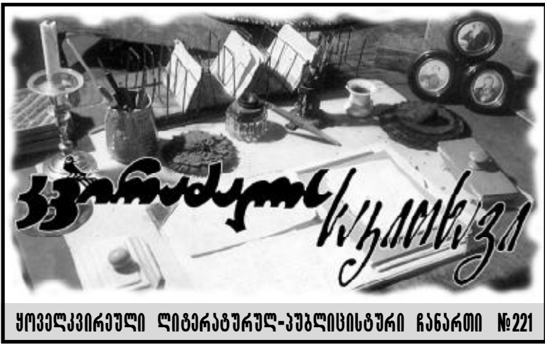
ყოველკვირეული ლიტერატურულ-კულტურული ჩანაწერი №221