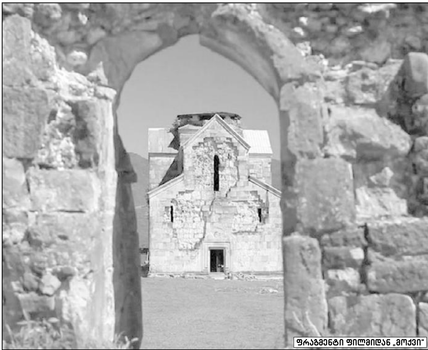
ფრაგმენტი ფილმიდან „მოქევი“

ქართველოს ეკლესიის მხოლოდ საეკლესიო-ადმინისტრაციულ ერთეულს წარმოადგენდა. სწორედ ამას გულისმობდნენ XVII საუკუნის იერუსალიმელი პატრიარქები დოსითეოსი და ხრისანო, როცა წერდნენ: „ივერიაში არსებობს ორი არქიეპისკოპოსი, რომელთაც ჩვეულების თანახმად უწოდებენ კათალიკოსებს. ასე მათ მხოლოდ ივერიაში უწოდებენ“.