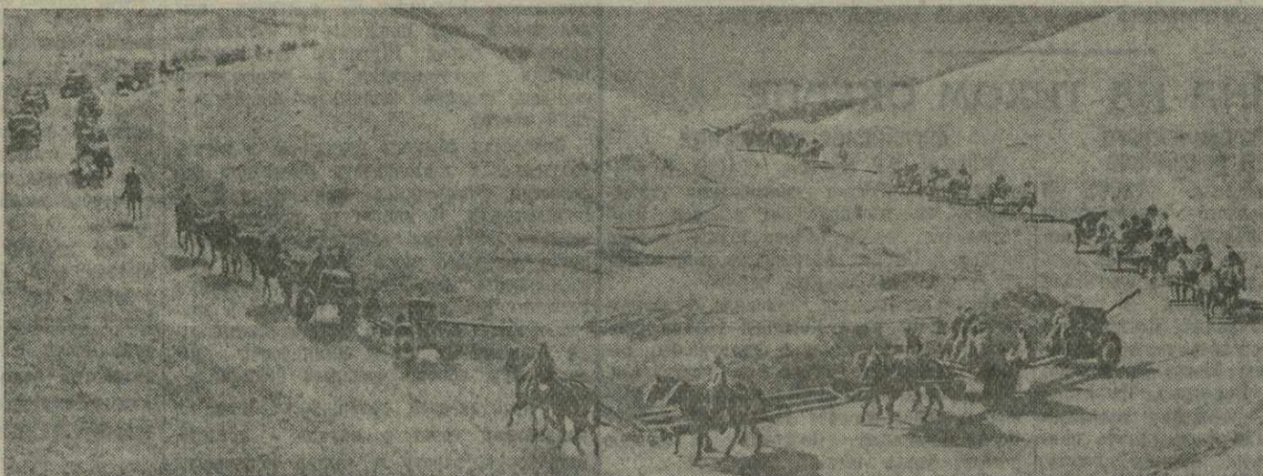
Германская оборона Севастополя. На снимке: артиллерия выезжает на огневые позиции.

А. ХОСРОВ. Севастополь, 17 февраля 1942 г.