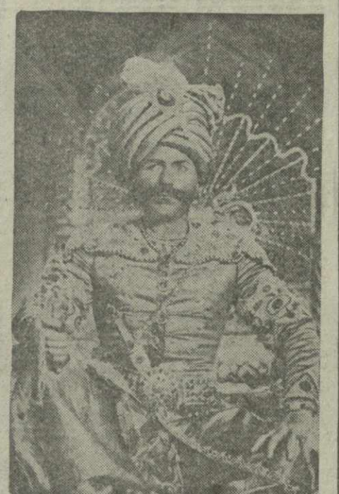
Народный артист СССР А. Васадзе в роли Шах-Аббаса.

Работа над фильмом «Георгий Саакадзе» подошла к концу.