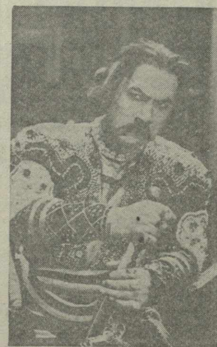
Народный артист СССР А. Хорав в роли Георгия Саакадзе.