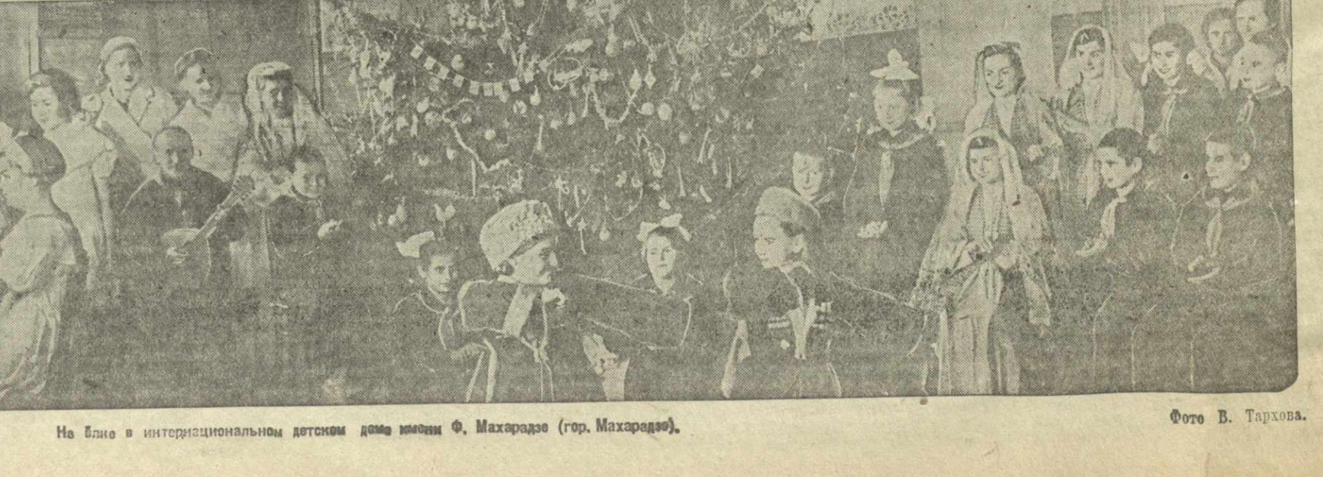
На Блине в интернациональном детском доме имени Ф. Махарадзе (гор. Махарадзе).

КИРОВ. Исполнилось 25 лет со дня основания Кировского педагогического института имени Ленина. За четверть века институт подготовил свыше 3.000 учителей средних школ, 100 научных работников вузов и научно-исследовательских институтов.