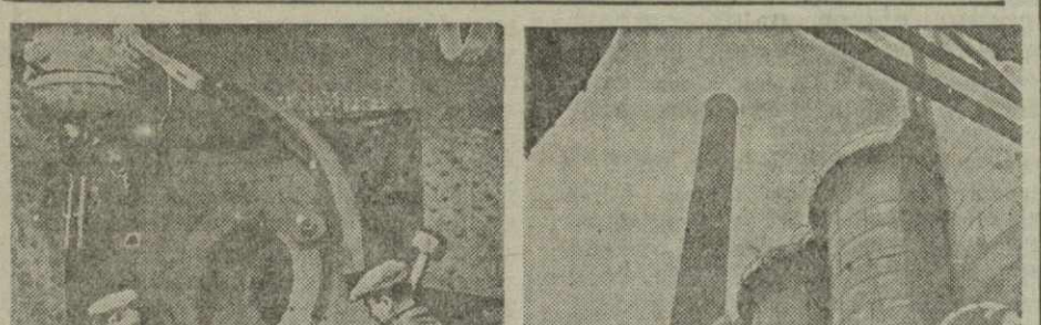
В освобожденном Донбассе на снимках: 1. Ремонт доменной печи на Енакиевском металлургическом заводе.

Начальник гарнизона г. Тбилиси генерал-лейтенант ХАДЖЕВ. Зам. ответственного редактора А. ГЕОРГАДЗЕ.