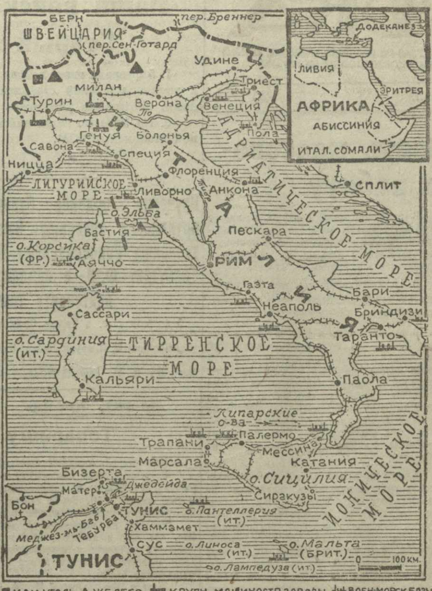
НАЛЕТ АВИАЦИИ СОЮЗНИКОВ НА ТУРИН, СПЕЦИО, РУР И ЛОРИАН

К новому подьему работы машинно-тракторных станций Эти совещания, созванные в репашлийский период подготовки к весенним сельскохозяйственным работам, призваны были способствовать дальнейшему улучшению работы политотделов МТС в выполнении стальных перед ними задач.