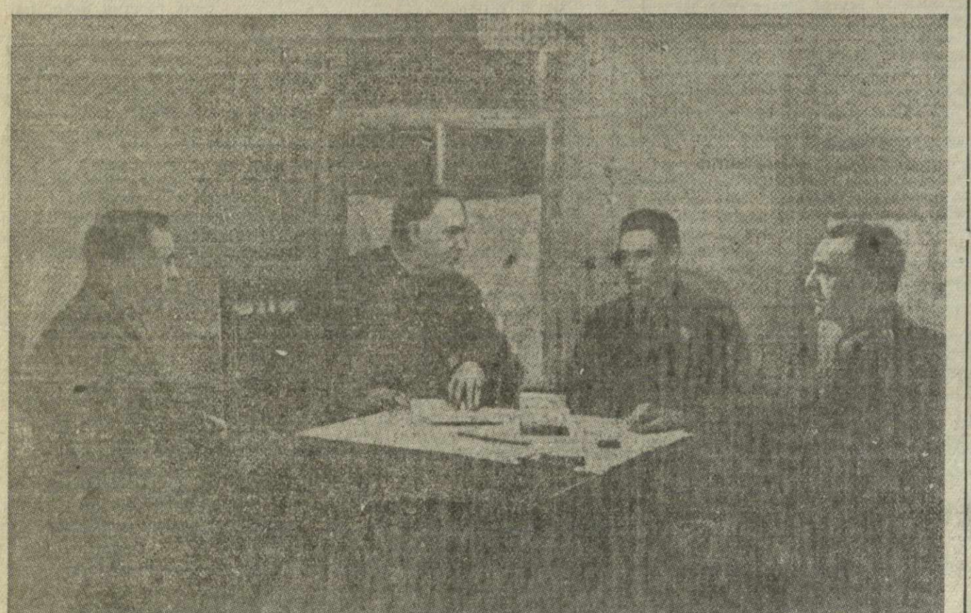
Маршал артиллерии т. Н. Н. Воронов и генерал-полковник т. К. К. Рокоссовский допрашивают пленного германского генерал-фельдмаршала Паулюса. На снимке: слева направо — генерал-полковник т. Рокоссовский, маршал артиллерии т. Воронов, переводчик майор т. Дятленко и Паулюс.

«Настоящим подтверждаю получение Вашей ноты от 3 февраля, в которой предлагается от имени Колумбийского правительства обменяться полномочными посланниками с СССР. С удовольствием отвечаю Вам, что вышеозначенное решение совпадает с желанием Советского правительства, от имени которого я имел честь принять Ваше предложение».