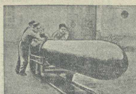
Тип торпеды, изготовляемой в Италии.

В юго-восточной части провинции Хубэй 18 февраля японские войска начали наступление из города Шань в юго-восточном и юго-западном направлениях. Предпринятая 19 февраля контрнаступление, китайские войска отнесли японцев обратно к Шаню, в районе которого бои продолжаются.