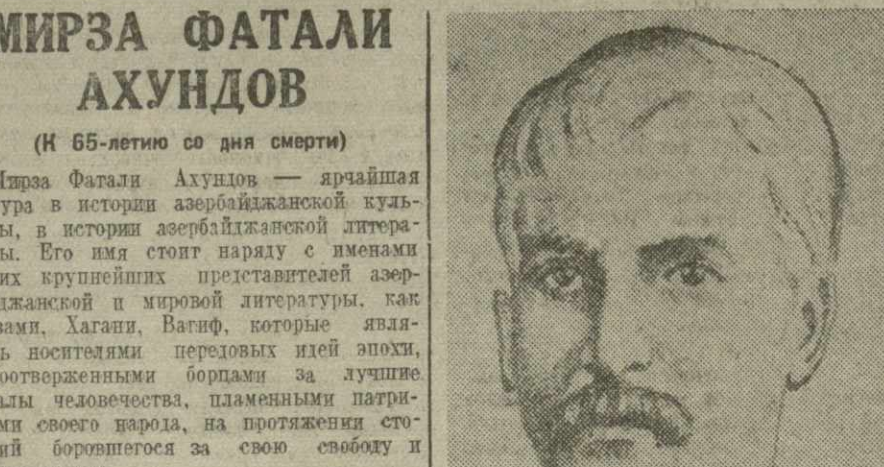
Мирза Фатали Ахундов. (К 65-летию со дня смерти)

Великую славу принесла Ахундову его драматургические произведения, в которых он затронул самые острые проблемы общественной жизни.