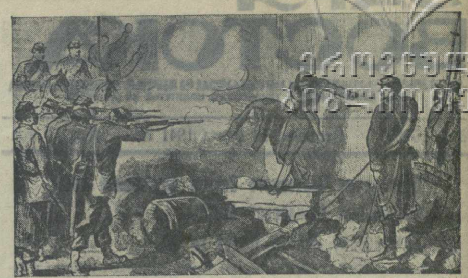
На снимках: слева—провозглашение Коммуны в Париже в 1871 г. (с гравюры), справа—расстрел коммунаров на улице Сен-Жермон 25 мая («Универс-Иллюстра»).