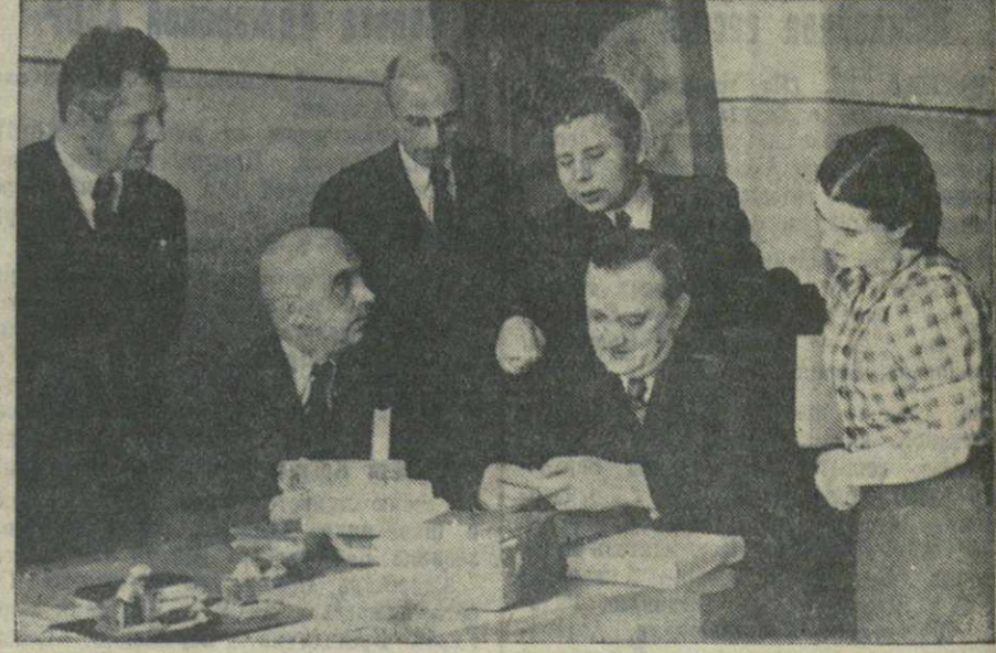
Находящаяся в Тбилиси делегация Львовского государственного университета имени И. Франко посетила 16 марта Тбилисский филиал Музея В. И. Ленина, филиал Института Маркса—Энгельса—Ленина и выставку грузинской литературы в Литературном музее. Делегаты побывали также на спектаклях в тбилисских театрах.

Свое пребывание в Тбилиси я хочу использовать для того, чтобы познакомиться с учеными Грузии, работающими над историей математики, и обменяться с ними опытом.