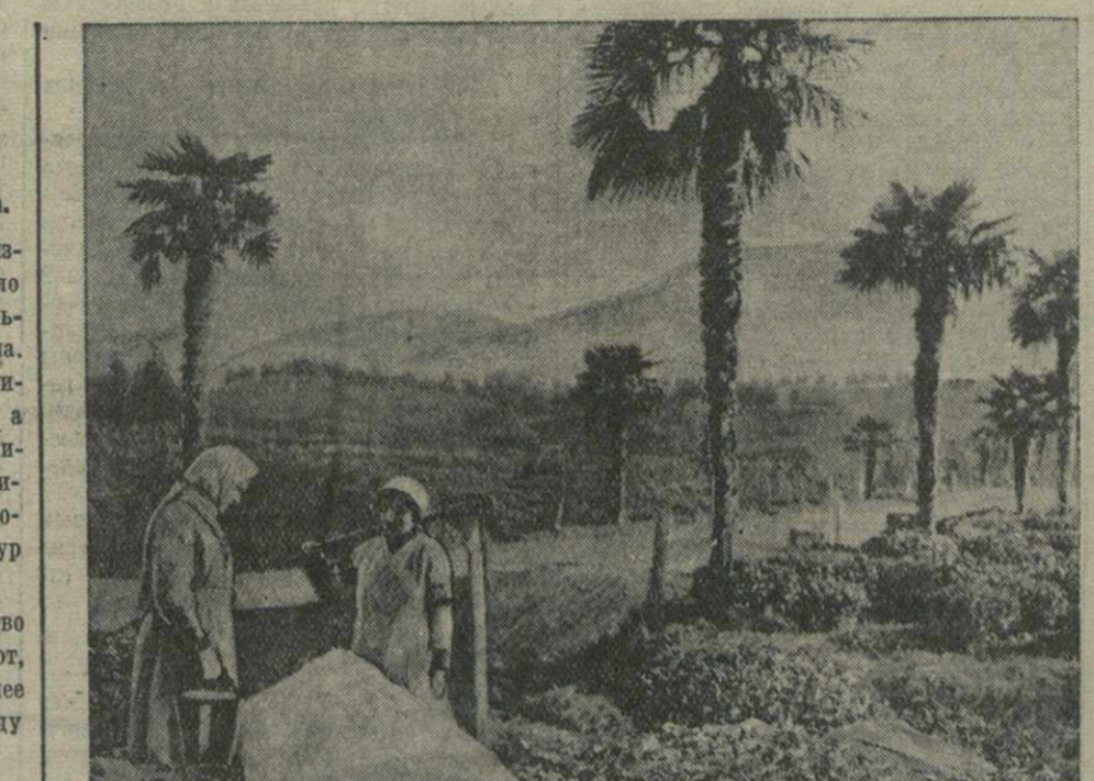
Внесение минеральных удобрений на чайных плантациях колхоза сел. Гурианта, Махарадзевского района.