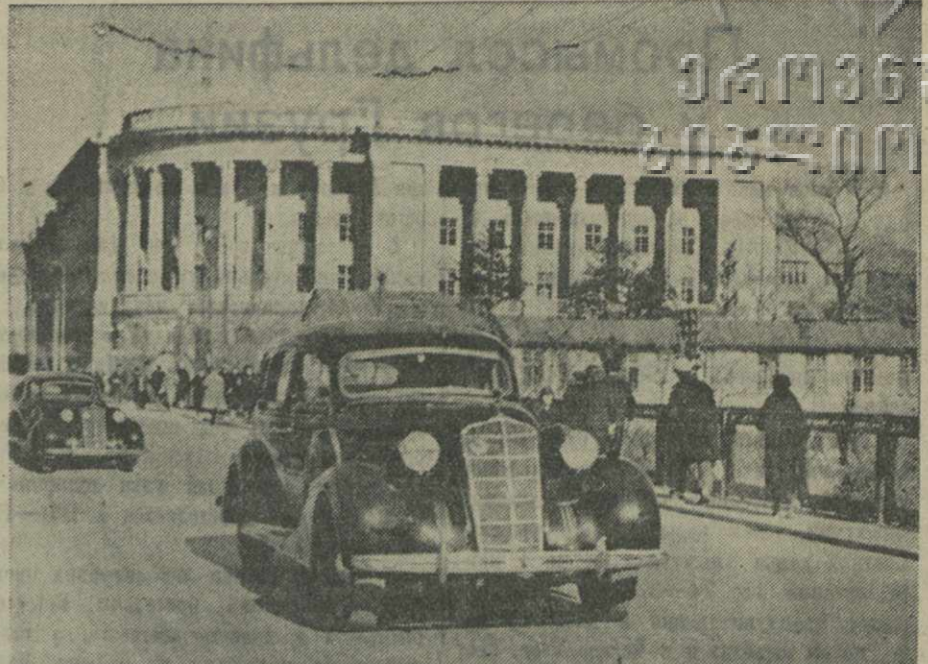
Тбилиси. На мосту им. Элбанидзе, у здания Дворца книги.

Вся территория завода покрыта железным ломом, различными частями оборудования, мусором.